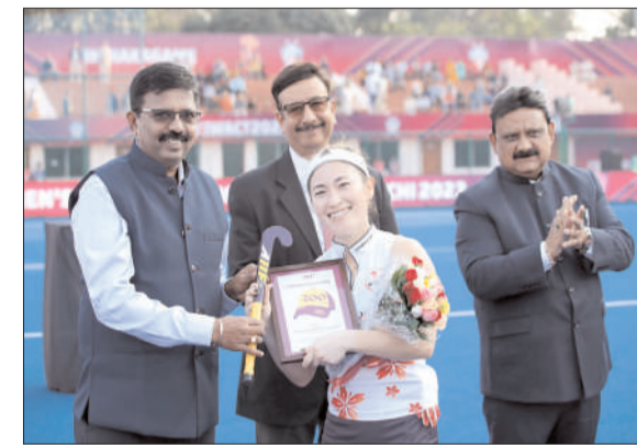
जापान के खिलाड़ियों ने शानदार खेल का प्रदर्शन कर कोरिया की टीम को चलने नहीं दिया। पहले

रांची। वीमेंस एशियन चैंपियनशिप हॉकी 2023 के दूसरे दिन शनिवार को पहला मैच डिफेंडिंग चैंपियन जापान व कोरिया के बीच खेला गया। इस मैच में जापान की टीम ने कोरिया को 4-0 से हराकर अपनी दूसरी जीत दर्ज की। वहीं, कोरिया की टीम की पहली हार हुई। जापान की टीम ने अपने पहले मैच में मलेशिया को 3-0 से हराकर शानदार शुरुआत की थी। वहीं, कोरिया की टीम ने कड़े संघर्ष के बाद चीन को 1-0 से हराया था। मोरहाबादी के मरांग गोमके एस्टेडियम हॉकी स्टेडियम में खेले गए मुकाबले में शुरू से ही