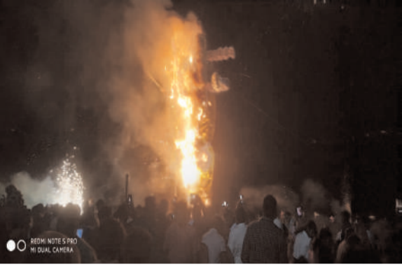
सिंदूर लगाकर मां से सुहाग रहने की कामना की। ए टाइप नॉर्थ सेटलमेंट दुर्गा पूजा कमेटी दुर्गा पंडाल बी टाईप दुर्गा पंडाल, वैष्णो देवी दुर्गा मंदिर, सहित अन्य मंदिरों में भारी भीड़ देखी गई। मान्यताओं के अनुसार, मां दुर्गा 10 दिन के लिए अपने मायके आती हैं, जिसे दुर्गा पूजा के रूप में मनाया जाता है और जब वह वापस जाती हैं तो उनकी विदाई में उनके सम्मान में सिंदूर खेला की रस्म की जाती है। मां दुर्गा विसर्जन के दौरान मुरी पुलिस मुस्तैद रहे। वहीं रेलवे ए टाईप सेटलमेंट दुर्गा पूजा कमेटी के