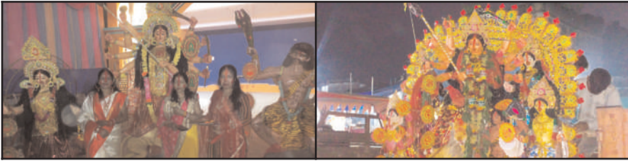
धज्जी महिलाओं ने पहले मां दुर्गा को सिंदूर अर्पित किया। फिर एक दूसरे को सिंदूर लगाकर %सिंदूर खेला% का रस्म निभाई। रस्म के दौरान महिलाओं ने एक-एक कर मां दुर्गा की आरती की और अपने सुहाग की लंबी उम्र की कामना की, सुहागिन महिलाओं ने एक दूसरे को सिंदूर लगाकर मां से सुहाग रहने की कामना की। ए टाइप नॉर्थ सेटलमेंट दुर्गा पूजा कमेटी दुर्गा पंडाल बी टाईप दुर्गा पंडाल, वैष्णो देवी दुर्गा मंदिर, सहित अन्य मंदिरों में भारी भीड़ देखी गई। मान्यताओं के अनुसार, मां दुर्गा 10 दिन के लिए अपने मायके आती हैं, जिसे दुर्गा पूजा के रूप में मनाया जाता है और जब वह वापस जाती हैं तो उनकी विदाई में उनके सम्मान में सिंदूर खेला की रस्म की जाती है। मां दुर्गा विसर्जन के दौरान मुरी पुलिस मुस्तैद रहे। वहीं रेलवे ए टाईप सेटलमेंट दुर्गा पूजा कमेटी के

प्रभात मंत्र संवाददाता सिंहरी : सिंहरी- मुरी क्षेत्र में विजयादशमी को लेकर सभी जगह मां दुर्गा की आराधना में लोग लीन थे। बंगाली समुदाय के लिए आज के दिन का एक अलग ही महत्व है। सिंहरी-मुरी में सुहागिन महिलाएं सुबह से ही मंदिरों में पहुंचकर मां को सिंदूर लगाकर सिंदूर खेला में शामिल हुईं। पारंपरिक लाल पाइ बाली सफेद रंग की साड़ी में सजी-