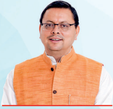
पुष्कर सिंह धामी मुख्यमंत्री, उत्तराखण्ड