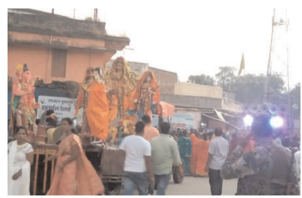
लोधमा, गोविन्दपुर के सार्वजनिक दुर्गा पूजा समिति गोविन्दपुर, दुर्गा पूजा समिति जरियागढ़ के लोगों ने मां दुर्गा के प्रतिमा का विसर्जन किया। वहीं बुधवार को सार्वजनिक दुर्गा पूजा समिति शिवालय कर व सार्वजनिक दुर्गा पूजा समिति महतो टोली कर के लोगों ने धूमधाम से ढोल नगाड़े के साथ मां दुर्गा कि प्रतिमा का लौकल तालाब में

धूमधाम व हर्षोल्लास से खलारी में संपन्न हो गया दुर्गापूजा प्रभात मंत्र संवाददाता खलारी : खलारी प्रखंड क्षेत्र में दुर्गापूजा का त्योहार पूरे भक्तिभाव, धूमधाम तथा शांतिपूर्ण माहौल में संपन्न हो गया। लोगों ने पूरी श्रद्धा व भक्ति भाव से मां दुर्गा की आराधना की। पूजा पंडालों में मां दुर्गा की आराधना से संबंधित मंत्रों की गूंज रही। कई लोगों ने पूरे नवरात्र में उवास किया। दशमी के दिन मंगलवार को महिलाओं ने पूजा पंडालों में सिंदूर लगाकर मां दुर्गा को विदा किया। सुहागिनों ने इस दौरान एक दूसरे को भी सिंदूर लगाया। श्रीजानकी रमण मंदिर, करकट्टा पंडाल सहित सभी पूजा पंडालों के सामने मेला लगाया गया था। बच्चों, महिलाओं ने मेले में जमकर खरीदारी की तथा व्यंजनों का लुप्त उठाया। नवमी के दिन 'जय माता दी रम्य' खलारी द्वारा श्रीजानकीरमण मंदिर पंडाल के बाहर खिचड़ी प्रसाद वितरण किया गया। विजयदशमी के दिन ही श्रीजानकी रमण मंदिर खलारी, करकट्टा, धमधमिया के पंडाल में स्थापित मां दुर्गा की प्रतिमाओं को नगर भ्रमण के बाद नजदीक के तालाबों, नदियों में विसर्जन कर दिया गया।