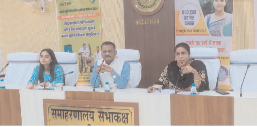
विस्तार से जानकारी दी गई जिसके तहत दिनांक 27.10.2023 को प्रारूप मतदाता सूची का प्रकाशन

प्रभात मंत्र संवाददाता हजारीबाग : समाहरणालय सभाकक्ष में मतदाता सूची विशेष सक्षिप्त पुनरीक्षण कार्यक्रम 2024 के निमित्त सभी राजनीतिक दलों के प्रतिनिधियों के साथ जिला निर्वाचन पदाधिकारी, हजारीबाग की अध्यक्षता में एक बैठक का आयोजन किया गया। बैठक में पुनरीक्षण कार्यक्रम के तहत मतदाता सूची के प्रारूप प्रकाशन, दावा एवं आपत्ति प्राप्त करने एवं उसका निष्पादन तथा मतदाता सूची का अन्तिम प्रकाशन हेतु आयोग द्वारा निर्धारित तिथियों के संदर्भ में