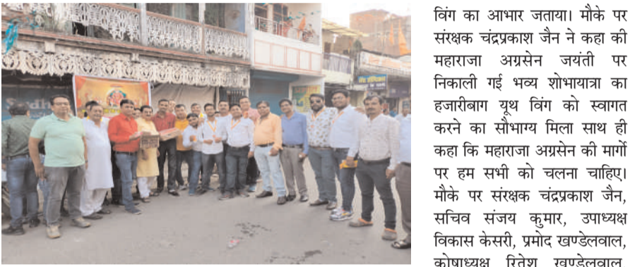
वही पदाधिकारियों ने लोगों के बीच जूस एवं पानी का वितरण किया। इस सेवा से प्रसन्न होकर मारवाड़ी अग्रवाल समाज ने हजारीबाग यूथ

प्रभात मंत्र संवाददाता हजारीबाग : शहर के सामाजिक एवं धार्मिक कार्यों में अपनी सहभागिता सुनिश्चित करने वाला हजारीबाग यूथ विंग के द्वारा शहर के बड़ा बाजार चौक के समीप मारवाड़ी अग्रवाल समाज के द्वारा महाराजा अग्रसेन की जयंती पर निकाली गई भव्य शोभायात्रा का स्वागत किया। समस्त पदाधिकारियों एवं सदस्यों ने शोभा यात्रा में सम्मिलित वरिष्ठ सदस्यों का स्वागत किया। उन्हें मोती की माला पहनकर उनका स्वागत किया गया।