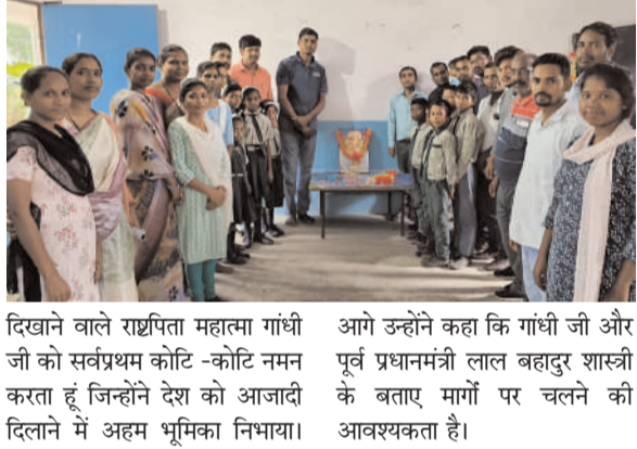
दिखाने वाले राष्ट्रपिता महात्मा गांधी जी को सर्वप्रथम कोटि -कोटि नमन करता हूँ जिन्होंने देश को आजादी दिलाने में अहम भूमिका निभाया।