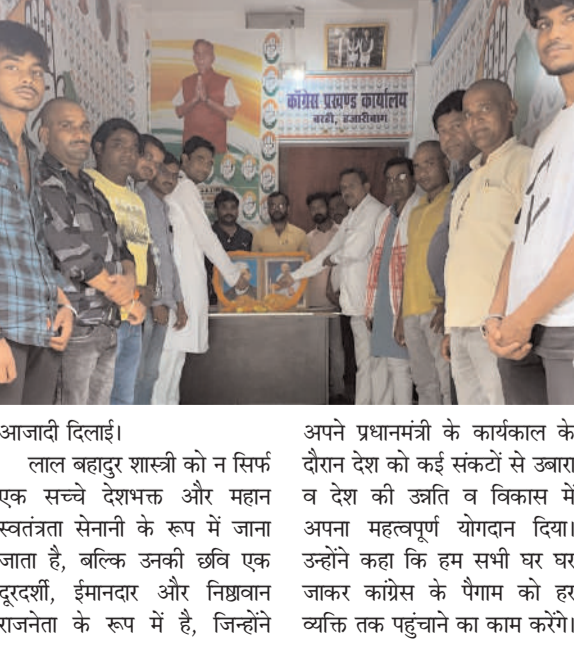
आजादी दिलाई। लाल बहादुर शास्त्री को न सिर्फ एक सच्चे देशभक्त और महान स्वतंत्रता सेनानी के रूप में जाना जाता है, बल्कि उनकी छवि एक दूरदर्शी, ईमानदार और निष्ठावान राजनेता के रूप में है, जिन्होंने