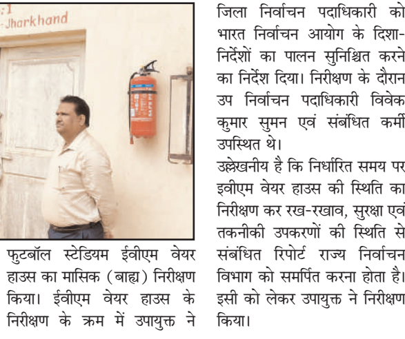
उपायुक्त ने मोरहाबादी स्थित बिरसा मुण्डा फुटवॉल स्टेडियम ईवीएम वेयर हाउस का मासिक (बाह्य) निरीक्षण किया। ईवीएम वेयर हाउस के निरीक्षण के क्रम में उपायुक्त ने

प्रभात मंत्र संवाददाता रांची : रांची के उपायुक्त राहुल कुमार सिन्हा ने शनिवार को मोरहाबादी स्थित बिरसा मुण्डा फुटवॉल स्टेडियम ईवीएम वेयर हाउस का मासिक (बाह्य) निरीक्षण किया। ईवीएम वेयर हाउस के निरीक्षण के क्रम में उपायुक्त ने