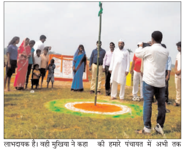
लाभदायक है। वही मुखिया ने कहा की हमारे पंचायत में अभी तक

एक ही अमृत सरोवर है लेकिन और मांग किये है। जहां यह तालाब है वहा काफी खेती योग्य जमीन है जिससे किसान लाभान्वित होंगे साथ ही मवेशियों को पिने की पानी का दिक्कत नहीं होगा। वही बताया की तालाब के पास फलदार वृक्षा रोपण भी किया जाना है वृक्षा रोपण से पर्यावरण में भी सुधार होगा। वही ग्रामीणों ने सरकार के इस योजना का साराहना की और कहा की इस तालाब के निर्माण से सिचाई के लिए समस्या नहीं होगी। मौके पर काफी संख्या में महिला पुरुष ग्रामीण उपस्थित थे।