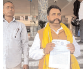
का भी ध्यान आकृष्ट कराया है। जिसमें पंचायत समिति सदस्य के हत्यारे को चिन्हित कर जल्द से जल्द गिरफ्तार करने की मांग की है।