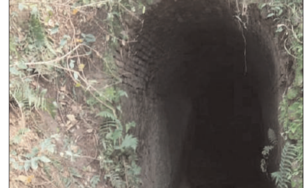
सभी मधुर सभी स पिपराताड के उचित कानूनी कार्रवाई करने की है। तथा उक्त लोगो को चिनिहित कर कृपा करें।