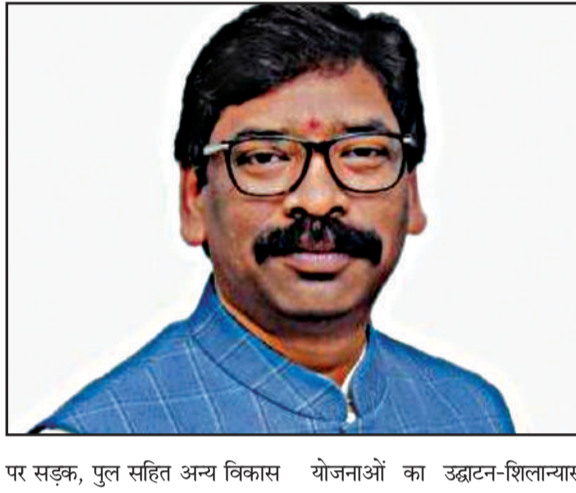
पर सड़क, पुल सहित अन्य विकास योजनाओं का उद्घाटन-शिलान्यास किया जायेगा।

प्रभात मंत्र संवाददाता रांची : मुख्यमंत्री हेमंत सोरेन 16 नवंबर से 'आपकी योजना आपकी सरकार आपके द्वार' कार्यक्रम का तीसरा चरण शुरू करने वाले हैं। पूरे राज्यभर में यह कार्यक्रम आयोजित किया जायेगा। मुख्यमंत्री ने इस बात निर्देश दिए हैं और अधिकारियों को जनता की समस्याओं का त्वरित समाधान करने करें। इस दौरान अभियान चलाकर जाति प्रमाण पत्र भी निगत किया जायेगा। इधर, राज्य स्थापना दिवस 15 नवंबर की तैयारी भी तेज कर दी गयी है। राज्य स्तर पर लगातार बैठकें की जा रही है।