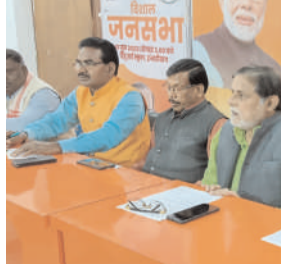
ने बताया कि हजारीबाग लोकसभा में आदिवासियों को मोदी सरकार अनेक लाभ पहुंचा रही है। सांसद जयंत सिन्हा के प्रयास इसमें अहम भूमिका निभा रहे हैं। उन्ही के प्रयास से विनोबा भावे विश्वविद्यालय में 8 करोड़ से सेंटर फॉर ट्राइबल स्टडीज का निर्माण हो रहा है। इस भवन का डिजाइन झारखंड के पहाड़ों के स्वरूप से लिया गया है। यहां विशाल संग्रहालय समेत प्रशासनिक भवन इत्यादि भी होंगे। यहां क्षेत्रीय व लोक कलाओं पर रिसर्च कर उनका

प्रभात मंत्र संवाददाता हजारीबाग : भाजपा कार्यालय अटल भवन के सभागार में भाजपा जिला अध्यक्ष अशोक यादव सहित भाजपा आदिवासी मोर्चा के नेताओं ने संयुक्त प्रेसवार्ता को संबोधित किया। इस अवसर पर जनजातीय समाज के उत्थान व हजारीबाग लोकसभा के समग्र विकास के लिए प्रधानमंत्री नरेंद्र मोदी व सांसद सह अध्यक्ष, वित्त सम्बन्धी संसदीय स्थायी समिति जयंत सिन्हा का आभार व्यक्त करते हुए भाजपा जिला अध्यक्ष अशोक यादव ने कहा की ज्ञात हो कि 20 नवंबर को सांसद जयंत सिन्हा ने रांची स्थित राजभवन में झारखंड के राज्यपाल सी.पी. राधाकृष्णन से मुलाकात की थी। उन्होंने राज्यपाल को हजारीबाग वासियों की ओर से सेंटर फॉर ट्राइबल स्टडीज के उद्घाटन के लिए आमंत्रित किया है। भाजपा नेताओं