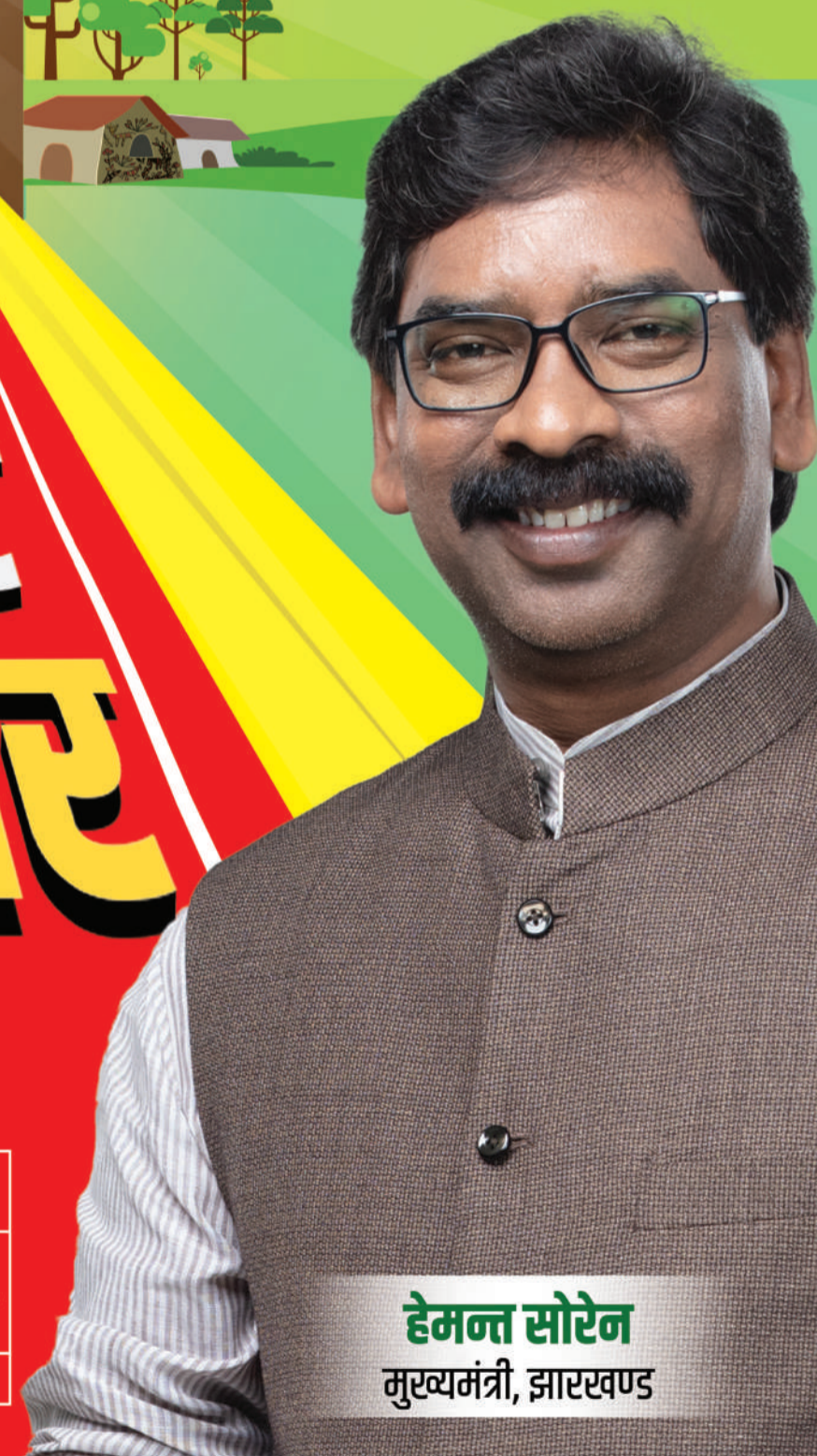
हेमन्त सोरेन मुख्यमंत्री, झारखण्ड

दोनों वर्षों में लगभग सभी प्राप्त आवेदनों का निष्पादन किया गया