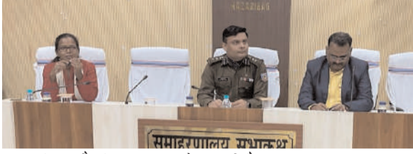
साथ पुलिस और जिला प्रशासन के संबंधित विभागों को खनन, वन, परिवहन, प्रदूषण, कारखाना विभागों के एक्ट के तहत समेकित कार्रवाई करने का निर्देश दिया। उन्होंने कहा कि एकल विभागीय कार्रवाई से अवैध खनन पर रोक लगाना संभव नहीं है। अतः अवैध खनन, परिवहन में सलिस वाहनों, माफिया पर हर सुसंगत धाराओं के तहत कार्रवाई करें। एसपी ने जिला परिवहन पदाधिकारी को नियमित रूप से अवैध परिवहन के विरुद्ध जांच