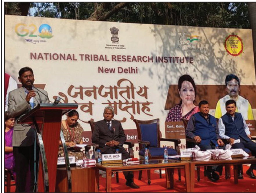
जनजातीय गौरव दिवस मविष्य को देगा नई दिशा

हाल ही में 24000 करोड़ रुपये का विशेष रूप से कमजोर जनजातीय समूह (पीवीटीजी) मिशन, आदि आदर्श ग्राम योजना, सिकल सेल मिशन, 740 एकलव्य मॉडल स्कूलों की स्थापना शामिल है।