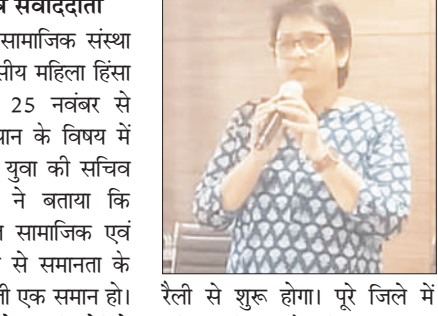
रैली से शुरू होगा। पूरे जिले में महिला हिंसा के खिलाफ 16 दिवसीय अभियान के तहत गोष्ठी नुकड़ नाटक, चित्रांकन, नारा लेखन सहित कई जागरूकता कार्यक्रम आयोजित किये जाएंगे।