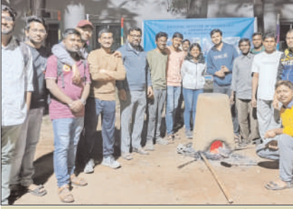
मॉडल प्रस्तुतिकरण एवं प्रतियोगिता 250 प्रतिभागियों दी प्रस्तुति