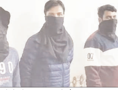
टीम गठित कर कार्रवाई की गई। इस दौरान तीन अपराधियों द्वारा हत्या की घटना को अंजाम देने के लिए योजना बनायी जा रही थी, जिसे पुलिस द्वारा विफल किया गया।