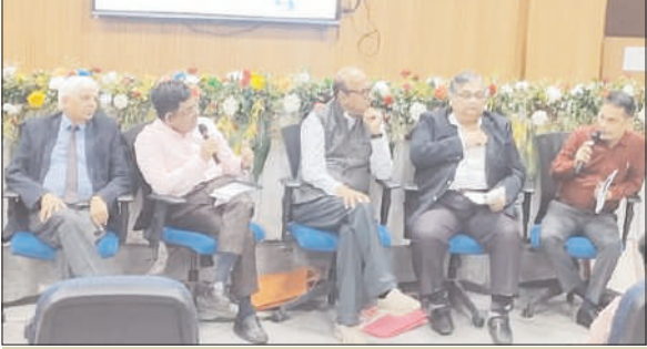
न्यूनतम कार्बन उत्सर्जन करने वाले स्टील प्लांट बनाने की जरूरत : विशेषज्ञ