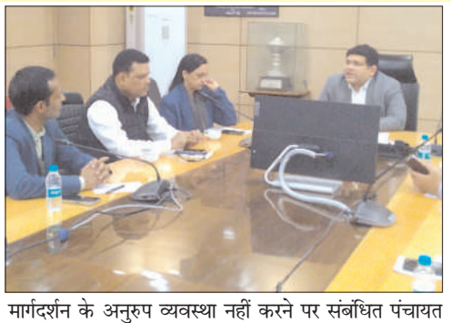
मार्गदर्शन के अनुरूप व्यवस्था नहीं करने पर संबंधित पंचायत

प्रभात मंत्र संवाददाता धनबाद : रविवार को उप विकास आयुक्त शशि प्रकाश सिंह की अध्यक्षता में समाहरणालय के सभागार में आपकी योजना आपकी सरकार आपके द्वार के दौरान 24 एवं 25 नवंबर को आयोजित शिविरों की समीक्षा की गई। इस दौरान उप विकास आयुक्त ने कहा कि शिविरों में जिला स्तरीय नोडल पदाधिकारी व सहायक नोडल पदाधिकारी की उपस्थिति से लोगों में उनकी समस्या का निश्चित रूप से समाधान हो जाने का विश्वास बढ़ता है। उन्होंने कहा कि उपायुक्त वरुण रंजन के निदेशानुसार आपकी योजना - आपकी सरकार - आपके द्वार कार्यक्रम के दौरान किसी भी शिविर में सरकार द्वारा तय रुपरेखा, मानक व