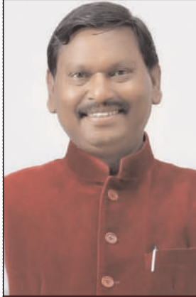
अर्जुन मुंजा केंद्रीय जनजातीय कार्य मंत्री

विविध संस्कृतियों और परंपराओं की भूमि भारत ने हमेशा देश की आजादी के लिए लड़ने वाले अपने बहादुर योद्धाओं के योगदान और बलिदान का जयन मनाया है। हालांकि, इस उत्सव के बीच, आदिवासी समुदाय की नीरता और संघर्ष पर अवसर ध्यान नहीं दिया गया। प्रधानमंत्री नरेंद्र मोदी का आदिवासी समाज और संस्कृति के प्रति सम्मान और अटूट प्रेम ही है, जिसमें भगवान बिरसा मुंडा की जन्म जयन्ती के दिवस को