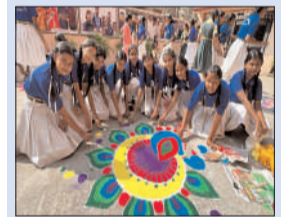
बच्चों ने स्कूल में बनाया रंगोली