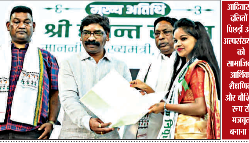
बच्चों की पढ़ाई में आर्थिक तंगी नहीं बनेगी बाधा

मुख्यमंत्री ने कहा कि स्थानीय और क्षेत्रीय भाषाओं को लगातार बढ़ावा दिया जा रहा है। इस दिशा में क्षेत्रीय भाषाओं के शिक्षकों के पद पर भी नियुक्ति की गई है। मुख्यमंत्री ने नवनियुक्त शिक्षकों से कहा कि उनकी जहां भी पोस्टिंग होती है, वहां की स्थानीय भाषा को वे जरूर सीखें और बच्चों के साथ उसी भाषा में संवाद करें। इससे बच्चों के पढ़ने और सीखने की क्षमता में काफी इजाफा होगा, जिसका फायदा बच्चों के साथ उनके अभिभावक, परिवार, समाज और राज्य को मिलेगा।