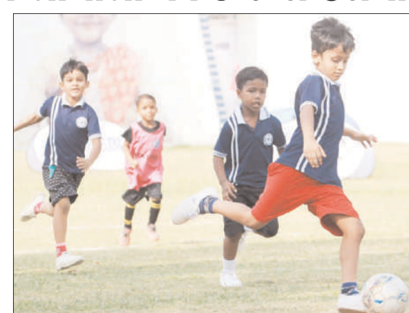
छात्र उपस्थित हुए, जैसे-जैसे प्रत्येक बीतेते सप्ताह के साथ लीग में रुचि बढ़ती जा रही है, वैसे-वैसे संख्या बढ़ती जा रही है।

प्रभात मंत्र संवाददाता जमशेदपुर : सागर स्टार ने जमशेदपुर गोल्डन बेबी लीग के 13वें वीकेड में लोयोला स्कूल के खिलाफ अंडर 5 वर्ग में एक और जीत के साथ जमशेदपुर गोल्डन बेबी लीग में अपना शानदार प्रदर्शन जारी रखा। अंडर 5 में जीत हासिल करने वाली सागर स्टार थी जिसने लोयोला स्कूल को हराया। ये लोयोला स्कूल के लिए अब तक का सबसे बड़ा झटका था क्योंकि लोयोला स्कूल पूरी जमशेदपुर गोल्डन बेबी लीग में अच्छा प्रदर्शन कर था है। रविवार को बेबी लीग के लिए कुल 229