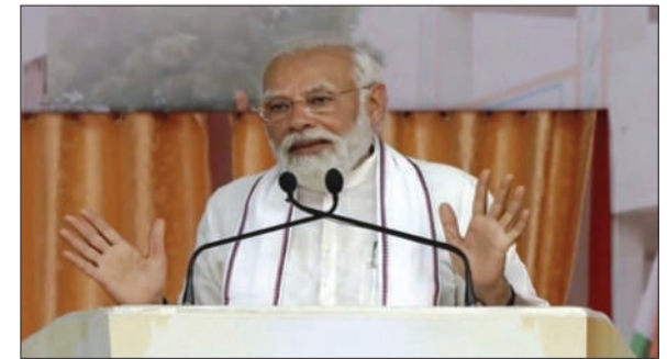
प्रेक्टिकल पर आधारित है। प्रधानमंत्री ने कहा कि राष्ट्रीय शिक्षा नीति, मातृभाषा में शिक्षण को बढ़ावा देती है। राष्ट्रीय शिक्षा नीति में जो एक बड़ा प्रावधान किया गया है, वो हमारे गांव-देहात और छोटे शहरों के शिक्षकों को बहुत मदद करने वाला है। ये प्रावधान मातृभाषा में पढ़ाई का है। उन्होंने कहा कि आज हमें समाज में ऐसा माहौल बनाने की भी जरूरत है जिसमें लोग शिक्षक बनने के लिए स्वेच्छा से आगे आएंगे। प्रधानमंत्री ने हर स्कूल का जन्मदिन

एजेंसी नई दिल्ली। प्रधानमंत्री नरेंद्र मोदी ने शुक्रवार को कहा कि 21वीं सदी के तेजी से बदलते समय में भारत की शिक्षा प्रणाली बदल रही है और शिक्षक और छात्र भी बदल रहे हैं। इन बदलती परिस्थितियों में हम कैसे आगे बढ़ेंगे यह तय करना महत्वपूर्ण है। प्रधानमंत्री ने गुजरात के गांधीनगर में अखिल भारतीय शिक्षा संघ अधिवेशन को संबोधित करते हुए अपनी बात रख रहे थे। उन्होंने कहा कि आज भारत, 21वीं सदी की आधुनिक आवश्यकताओं के मुताबिक नई व्यवस्थाओं का निर्माण कर रहा है। नई राष्ट्रीय शिक्षा नीति इसी को ध्यान में रखते हुए बनाई गई है। उन्होंने कहा कि हम इतने वर्षों से स्कूलों में पढ़ाई के नाम पर अपने बच्चों को केवल किताबी ज्ञान दे रहे हैं। नई राष्ट्रीय शिक्षा नीति उस पुरानी अप्रासंगिक व्यवस्था को परिवर्तित कर रही है। राष्ट्रीय शिक्षा नीति