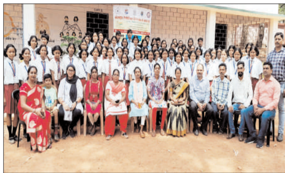
किया गया है। जनमानस में जैव विविधता के प्रति जागरूकता लाने के लिए संयुक्त राष्ट्र अधिवेशन द्वारा 22 मई को अंतर्राष्ट्रीय जैव विविधता दिवस घोषित किया गया है। प्रतिवर्ष मनाया जाता है ताकि जैव विविधता को बचाया जा सके इसकी संरक्षण हेतु कक्षा आठवीं से

प्रभात मंत्र संवाददाता बेड़ो : अंतर्राष्ट्रीय जैव विविधता दिवस के उपलक्ष में एएसएस प्लस टू उच्च विद्यालय एवं कस्तूरबा गांधी बालिका विद्यालय में शुक्रवार को झारखंड जैव विविधता पार्षद एवं प्रगति एजुकेशनल अकैडमी रांची के संयुक्त तत्वाधान पर जैव विविधता पर जो खतरा मंडरा रहे हैं। बहुत जीव जंतु इस प्राणी जगत से विलुप्त होने के कगार पर हैं। इसके संरक्षण संवहनीय उपयोग तथा जैविक संपदा से प्राप्त लाभों के समुचित बंटवारे हेतु भारत सरकार द्वारा जैविकीय विविधता अधिनियम 2002 पारित