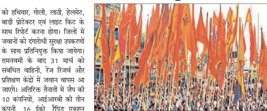
के चिन्हित अति संवेदनशील क्षेत्रों में रैंपिड एक्शन फोर्स की तैनाती की जाएगी। झारखंड पुलिस प्रवक्ता एबी होमकर

प्रभात मंत्र संवाददाता रांची : झारखंड में रामनवमी के पर्व पर सुरक्षा के कड़े इंतजाम किए जाएंगे। राजधानी रांची सहित राज्य के 24 जिलों में लगभग दस हजार अतिरिक्त बलों की प्रतिनियुक्ति की जायेगी। इसमें सशस्त्र बल और लाठी बल भी शामिल हैं। पुलिस मुख्यालय ने इस संबंध में आदेश जारी कर दिया है। अनुसार 27 मार्च तक प्रतिनियुक्त बलों को संबंधित जिलों में पहुंचना होगा। पुलिस बल को हथियार, गोली, लाठी, हेलमेट, बाड़ी प्रोटेक्टर एवं लाइट फिट के साथ रिपोर्ट करना होगा। जिलों में जवानों को दंगारोधी सुरक्षा उपकरणों के साथ प्रतिनियुक्त किया जायेगा। रामनवमी के बाद 31 मार्च को संबंधित चाहिनी, रेंज रिजर्व और प्रशिक्षण केंद्रों में जवान वापस आ जाएंगे। अतिरिक्त तैनाती में जैप की 10 कंपनियां, आईआरबी की तीन कंपनी, 16 ईको, रैंपिड एक्शन फोर्स की छह कंपनियां को भी लगाया गया है। राज्य के सभी जिलों