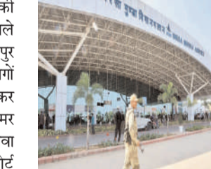
उड़ान भरेगा। यह सप्ताह में तीन दिन सोमवार, शुक्रवार और रविवार को रांची से गोवा के बीच उड़ान भरेगा। यह विमान शाम में 6:15 मिनट पर उतरेगा और शाम 6:45 मिनट पर उड़ान भरेगा।

करना चाहती है। हालांकि विमान कंपनी ने कहा है कि डेट को लेकर अभी हेडक्वार्टर से नोटिफिकेशन नहीं आया है। वहीं रांची से गोवा के लिए 27 मार्च से विमान सेवा शुरू होगी। इसी दिन देवघर के लिए भी विमान उड़ान भरेगा। अभी तक रांची से गोवा के लिए 150 यात्रियों ने बुकिंग भी करा ली है। वहीं रांची से देवघर के लिए शुरू होने वाले 72 सीटर विमान में 44 यात्रियों ने बुकिंग प्रसाद ई है। रांची से जयपुर के विमान से जोड़ने के लिए लंबे समय से मांग चल रही है। यहां के बिजनेसमैन जयपुर व्यवसाय के लिए जाते हैं। वहीं घूमने की दृष्टिकोण से जयपुर जानेवाले पर्यटकों की संख्या काफी है। जयपुर की सीधी सेवा नहीं होने से लोगों को दिल्ली या कोलकाता जाकर फ्लाइट लेना पड़ता था। समर फ्लायट में जयपुर की विमान सेवा को जोड़ने के लिए एयरपोर्ट अथॉरिटी ऑफ इंडिया ने प्रस्ताव डीजीसीए के पास भेजा था, जिसे मंजूर मिल गई है। रांची से दिल्ली के लिए एक और विमान सेवा शुरू होगी। रांची से दिल्ली के बीच सातों दिन विमान सेवा शुरू होगी। वहीं रांची से गोवा के लिए भी विमान