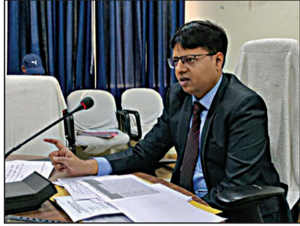
बर्ड फ्लू की घटना से प्रभावित क्षेत्र के एक किलोमीटर के दायरे के

उपलब्धता का सर्वेक्षण कर रही है। साथ ही माइक के जरिए लोगों को जागरूक कर रही है। इस क्षेत्र के स्वच्छ घोषित होने के 21 दिन के बाद ही मुर्गा -अंडा का ऋय-विक्रय किया जा सकेगा। बर्ड फ्लू की रोकथाम से संबंधित एक्शन प्लान के तहत एक से दस किलोमीटर की परिधि में मुर्गा और अंडा के ऋय-विक्रय पर अगले आदेश तक प्रतिबंध रहेगा। साथ ही इस एक से 10 किलोमीटर की परिधि में पूर्व से उपलब्ध मुर्गा को इस दायरे से बाहर भेजने और बाहर से मुर्गा- अंडा को लाने पर भी रोक लगा दी गयी है।