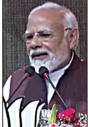
प्रधानमंत्री मोदी ने की बुरहानपुर की नारी शक्ति के प्रयासों की सराहना प्रधानमंत्री नरेंद्र मोदी ने मध्य प्रदेश के बुरहानपुर जिले की नारी शक्ति के प्रयासों की सराहना की है। उन्होंने रविवार को ट्वीट के माध्यम

एजेंसी नई दिल्ली : प्रधानमंत्री कल (सोमवार) को 'स्वास्थ्य व चिकित्सा अनुसंधान' पर बजट बाद वेबिनार को संबोधित करेंगे। केंद्र सरकार 12 पोस्ट-बजट वेबिनार आयोजित कर रही है। कल का वेबिनार भी इसी का हिस्सा है। वेबिनार बजट घोषणाओं के कार्यान्वयन के लिए अंतर्दृष्टि और विचारों को एकत्रित करेगा। वेबिनार में तीन एक साथ ब्रेकआउट सत्र होंगे, जिसमें नए नर्सिंग कॉलेजों की स्थापना, आईसीएमए और प्रयोगशालाओं के सार्वजनिक और निजी क्षेत्र के उपयोग और चिकित्सा उपकरणों के लिए फार्मा इनोवेशन और बहु-विषयक पाठ्यक्रमों से संबंधित बजट घोषणाएं शामिल होंगी।