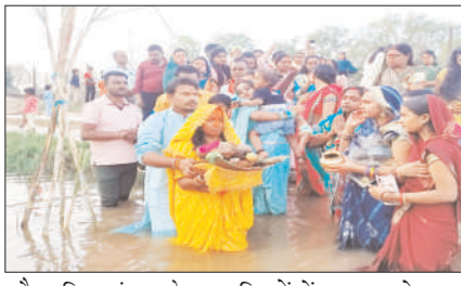
और पश्चिम बंगाल के कुछ हिस्सों में धूमधाम से मनाई जाती है। पुराणों में बताया गया है कि नवरात्र की षष्ठी तिथि को चैती छठ में भगवान सूर्यदेव की पूजा होती है। सूर्यदेव ने देवमाता अदिति के गर्भ से जन्म लिया था और आगे चलकर विवस्वतान और मार्तण्ड कहलाए। इन्हीं की संतान वैवस्वत मनु भी हुए। जिनसे आगे चलकर सृष्टि का विकास हुआ।

प्रभात मंत्र संवाददाता विष्णुगढ़ : विष्णुगढ़ प्रखंड के करोंज मोड़ स्थित जमुनिया नदी छठ घाट एवं सातमाइल जमुनिया जलाशय में डूबते सूरज को चैती छठ का पहला अर्घ्य सोमवार को दिया गया। इस दौरान जमुनिया नदी छठ घाट में चैती छठ पूजा के शुभ अवसर पर छठवती श्रद्धालुओं की काफी भीड़ उमड़ पड़ी, इस चैती छठ पर्व की आस्था से लोगों में उत्साह दिन प्रतिदिन बढ़ती ही जा रही है। यह पर्व चैती छठ पूजा व्रत लोक आस्था एवं सूर्य भगवान, उषा, प्रकृति, जल, वायु आदि को समर्पित है। चैती छठ चैत्र मास के नवरात्र में षष्ठी तिथि को हर साल चैती छठ का त्योहार मनाया जाता है। पुराणों के अनुसार, कार्तिक मास की छठ और चैत्र मास की छठ का विशेष महत्व होता है। कार्तिक मास की छठ दीपावली के तुरंत बाद पूर्वी उत्तर प्रदेश, बिहार