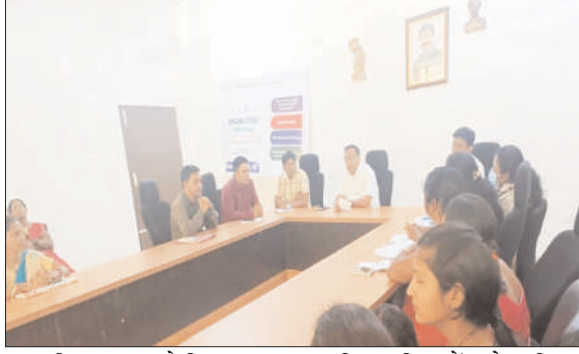
चयन किया जाएगा जो कि स्वच्छता चयनित महिलाओं को प्रशिक्षण से संबंधित समूह कार्य कर रही हैं। दिया जाना है। स्वच्छता उत्सव

खूटी : नगर पंचायत, खूटी के कार्यपालक पदाधिकारी की अध्यक्षता में नगर पंचायत के सभागार में स्वच्छता उत्सव 2023 को लेकर बैठक का आयोजन किया गया। इसमें सभी स्वयं सहायता समूह एवं एरिया लेवल फेडरेशन के महिला समूह शामिल हुईं। स्वच्छता उत्सव के तहत सभी वार्डों से सहायता समूह की महिलाओं का चयन किया जाना है। इनमें से महिला आइकॉन का भी