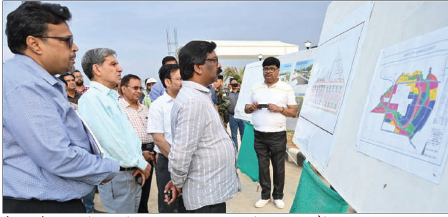
योजना को पूर्ण करने का निर्देश भी पदाधिकारियों को दिया। मौके पर मुख्य सचिव सुखदेव सिंह, मुख्यमंत्री के सचिव विनय कुमार चौबे सहित अन्य पदाधिकारी उपस्थित थे।

रांची : मुख्यमंत्री हेमन्त सोरेन ने स्मार्ट सिटी धुवां रांची में मंत्रियों के लिए बन रहे निर्माणधीन आवास एवं आवासीय परिसर का औचक निरीक्षण किया। मुख्यमंत्री ने संबंधित पदाधिकारियों से माननीय मंत्रियों के लिए बन रहे निर्माणधीन आवास से संबंधित सभी कार्यों की बिंदुवार जानकारी ली तथा आवश्यक दिशा-निर्देश भी दिए। मुख्यमंत्री ने तेज गति से आवासीय परिसर का निर्माण कार्य करते हुए निर्धारित समावधि में