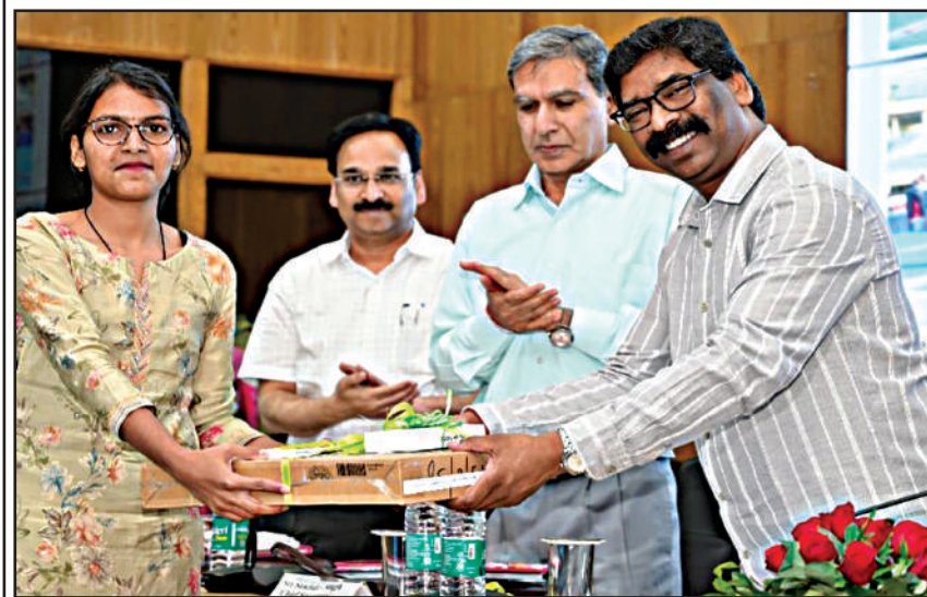
कार्यक्रम में इनकी रही उपस्थिति

राज्य के 130 छात्र-छात्राओं के बीच 1 करोड़ 32 लाख रुपये की नकद राशि, लैपटॉप और मोबाइल सम्मान स्वरूप प्रदान किया गया