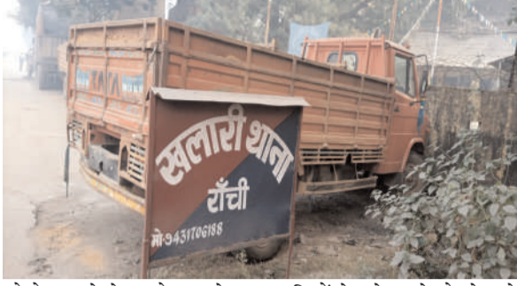
को रोजगार से लेकर जोड़ कर देखा जा रहा है। और यही अवैध कोयला का खबर समाचार पत्रों में छपने के बाद चौक चौराहों पर लिस सिंडिकेट

रविन्द्र कुमार @ प्रभात मंत्र खलारी : खलारी थाना क्षेत्र में कोयला माफियाओं का मनोबल दिन दुगुनी रात चौगुनी बनी हुई है। कोयला माफियाओं का कारनामा बेधड़क प्रसासन के नाक के नीचे हो रही है। इस कोयला तस्करी से कई बड़े नामी गिरामी सफेदपोश ही लिस है। इस सफेद पोशों के इशारे पर सारा कारनामा किया जाता है। जिसके लिए जगह जगह के भूतों को मोटी रकम का चढ़ावा दिया जाता है। बताया तो ये भी जाता है कि इन सभी अवैध कोयला धंधों