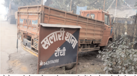
को रोजगार से लेकर जोड़ कर देखा जा रहा है। और यही अवैध कोयला का खबर समाचार पत्रों में छपने के बाद चौक चौराहों पर लिस सिंडिकेट

रविन्द्र कुमार @ प्रभात मंत्र खलारी : खलारी थाना क्षेत्र में कोयला माफियाओं का मनोबल दिन दुगुनी रात चौगुनी बनी हुई है। कोयला माफियाओं का कारनामा बेधड़क प्रसासन के नाक के नीचे हो रही है। इस कोयला तस्करी से कई बड़े नामी गिरामी सफेदपोश ही लिस है। इस सफेद पोशों के इशारे पर सारा कारनामा किया जाता है। जिसके लिए जगह जगह के भूतों को मोटी रकम का चखवा दिया जाता है। बताया तो ये भी जाता है कि इन सभी अवैध कोयला धंधों