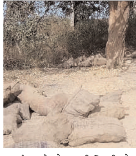
समर्थन सफेदपोश नामी गिरामी लोग भी करते रहते हैं। बताया चाहते हैं कि खलारी थाना क्षेत्र में अवैध कोयला, लोहा की चोरी कर तस्क

व जगह जगह के भूत मालामाल हो रहे हैं। चाहे इसके लिए राजस्व का घाटा कितना भी हो। आकलन के हिसाब से सिर्फ छः महीने के सीजन में कोयला तस्करी कर राजस्व का कई हजार करोड़ रुपये का चपल लगा देते हैं। इन सभी तस्करी के मामलों में न ही सीसीएल के जुआरू श्रमिक नेता का बयान आता है, और न ही इसमें किसी भी तरह से रोकने टोकने का प्रयास किया जाता है। यही श्रमिक नेता जो बात बात पर धरना प्रदर्शन कर सीसीएल के खदान को ठप करा देते हैं। लेकिन