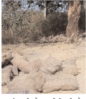
समर्थन सफेदपोश नामी गिरामी लोग ही करते रहते हैं। बताया चाहते हैं कि खलारी थाना क्षेत्र में अवैध कोयला, लोहा की चोरी कर तस्करी

व जगह जगह के भूत मालामाल हो रहे हैं। चाहे इसके लिए राजस्व का घाटा कितना भी हो। आकलन के हिसाब से सिर्फ छः महीने के सीजन में कोयला तस्करी कर राजस्व का कई हजार करोड़ों रुपये का चपत लगा देते हैं। इन सभी तस्करी के मामलों में न ही सीसीएल के जुआरू श्रमिक नेता का बयान आता है, और न ही इसमें किसी भी तरह से रोकने दोकने का प्रयास किया जाता है। यही श्रमिक नेता जो बात बात पर धरना प्रदर्शन कर सीसीएल के खदान को ठप करा देते हैं। लेकिन