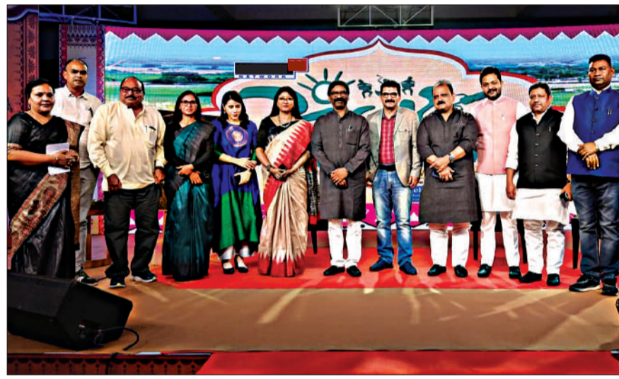
कार्यक्रम में इनकी रही उपस्थिति

राज्य में बिजली से संबंधित समस्याओं का समाधान किया गया है। सरकार गठन के बाद से ही हमने बैसिक रूट को मजबूत करने की कवायद तेज कर दी है। जिस गति से हमारी सरकार विकास के आयाम को बढ़ा रही है, अगर इसी गति से विकास के कार्य होते रहेंगे तो वह दिन दूर नहीं जब एक-एक झारखंडवासी गौरवान्वित महसूस करेगा। मुख्यमंत्री ने कहा कि हमारी सरकार ने नवसल प्रभावित क्षेत्रों में भी कई उल्लेखनीय काम किए हैं। पहले बूझ पड़ने के लोग शहर नहीं देख पाए थे और शहर के लोग बूझ पड़ने जाने का साहस नहीं दिखा पाते थे। हमारी सरकार ने उस स्थिति को बदलने का कार्य कर दिखाया है।