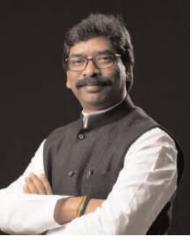
सर्च अभियान चलाए जाने पर कई ऐसे नक्सलियों के हथियार बरामद हुए हैं, जो विदेशी हैं इन सभी को देखते हुए पुलिस अब नए तकनीक से नक्सलियों पर अंकुश लगाने में जुटी हुई है। मुख्यमंत्री हेमंत सोरेन अपने हथियार की खरीदारी करने की योजना बनाई है।

रांची : झारखंड विधानसभा में चल रहे बजट सत्र के दौरान हेमंत सरकार ने पुलिस के जवानों को नए आधुनिक हथियार से लैस करने को हरी झंडी दिखा दी है। इसके तहत नए रायफल की खरीदारी को राज्य सरकार ने स्वीकृति दे दी है। राज्य सरकार इसके लिए कुल 43,84,83,47 रुपये खर्च करेगी। इससे पुलिस को 3,179 इन्सास राइफल (5.56 एम एम) दी जाएगी। इसके साथ ही 4,767 मोटर बम (51एम एम) देने की भी स्वीकृति दी गई है। बताते चलें कि नए हथियार की आवश्यकता इसलिए पड़ रही है क्योंकि हाल के दिनों में झारखंड में नक्सलियों की गतिविधियों के दौरान पुलिस द्वारा