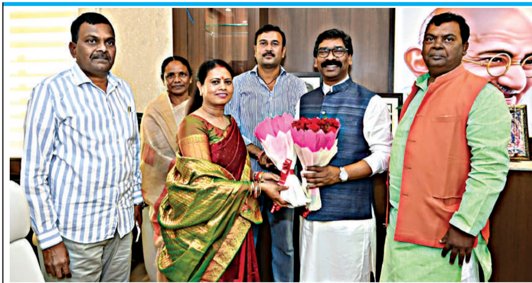
नियोजन नीति पर मंत्री आलमगीर आलम ने दिया जवाब

इसी बीच आजसू विधायक सुदेश महतो ने कहा कि 60 और 40 रेशियो क्या है, सरकार इसे बनाए। वहीं नियोजन नीति को सदन में लाने के बजाय कैबिनेट से पारित कराने को लेकर जेएमएम विधायक ने सरकार पर सवाल उठाए। नियोजन नीति को लेकर सरकार की ओर से जवाब