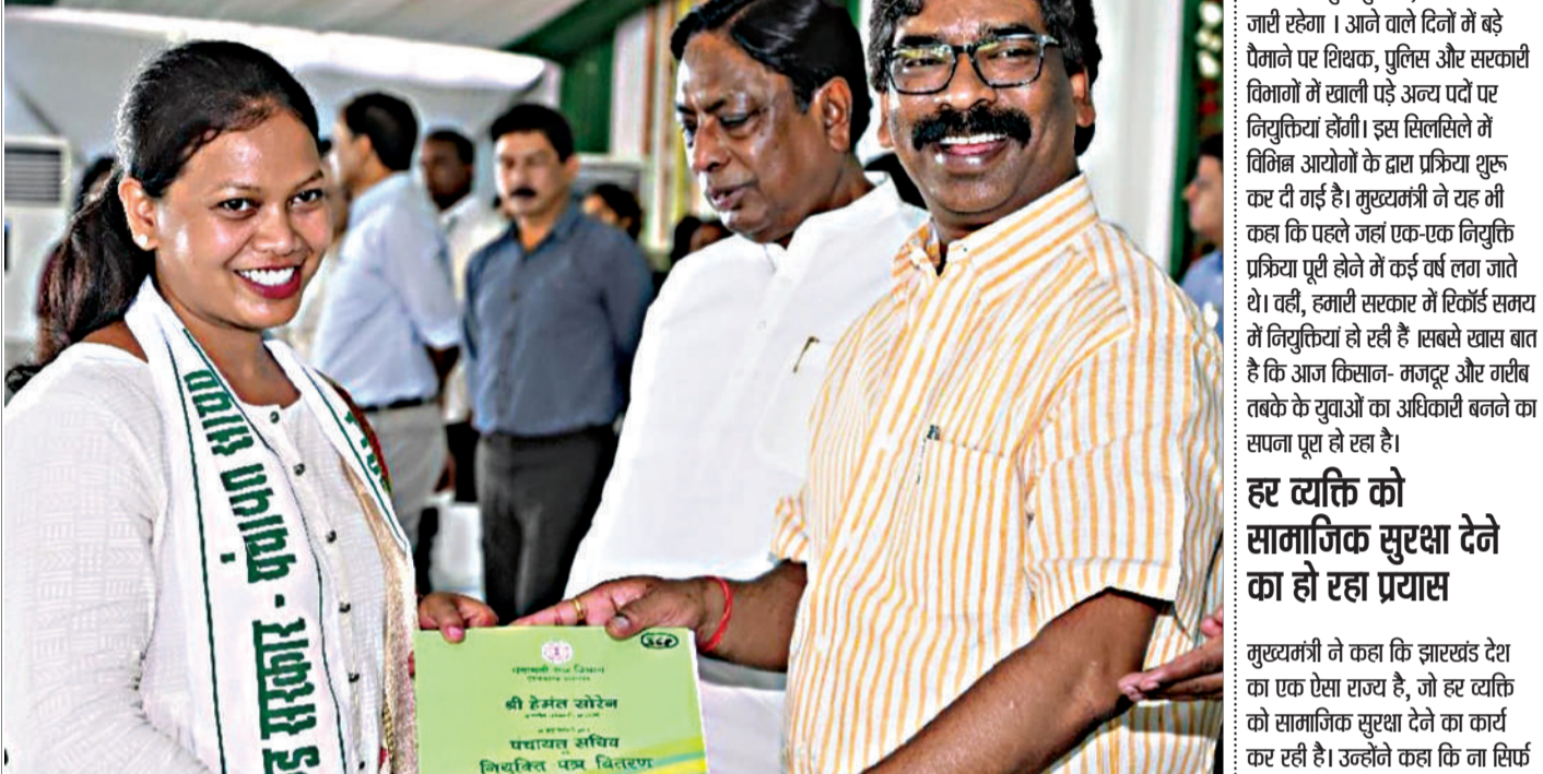
मुख्यमंत्री ने कहा कि झारखंड देश का एक ऐसा राज्य है, जो हर व्यक्ति को सामाजिक सुरक्षा देने का कार्य कर रही है। उन्होंने कहा कि ना सिर्फ सरकारी कर्मियों की पुरानी पेंशन योजना को लागू करने का सरकार ने ऐतिहासिक काम किया है, वहीं सर्वजन पेंशन योजना के माध्यम से सभी बुजुर्गों, विधवाओं, परित्रयताओं और दिव्यांगों को पेंशन देने का काम कर रहे हैं। उन्होंने कहा कि पेंशन किसी भी व्यक्ति के बुढ़ापे की लौदी होती है और सरकार उस हल में देने का काम करेगी।

राज्य को गरीबी, अशिक्षा और पिछड़ेपन के कुपड़ से बाहर निकालने का काम करें। आप एक कदम चलेंगे तो सरकार भी एक कदम चलने का हौसला देगी।