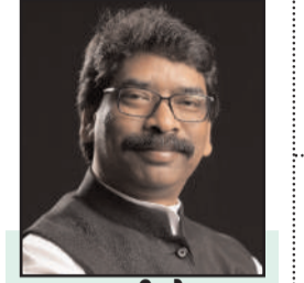
मुख्यमंत्री ने कहा

* सरकार के अंग के रूप में आपके जुड़ने से व्यवस्था को मजबूती मिलेगी * आप अपने पंचायत के सिर्फ पंचायत सचिव ही नहीं बल्कि उसके बीडीओ- सीओ, डीसी-एसपी सब हैं * नई-नई नियुक्तियों से सरकार को ऊर्जा मिलती है * युवाओं के सपने को कर रहे हैं साकार * हर व्यक्ति आगे बढ़े, यहीं हमारा संकल्प है