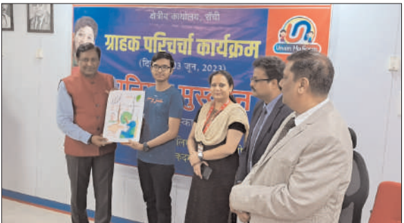
अभिभावकों को जागरूक किया गया। कार्यक्रम के विशिष्ट अतिथि तथा निर्णायककर्ता द्वारा 0-6, 7-10, 11-18 वर्ष के आयुवर्ग में

प्रभात मंत्र संवाददाता रांची। यूनियन मुस्कान, यूनियन बैंक ऑफ इंडिया की एक महत्वकांक्षी एवं बच्चों के भविष्य को संरक्षित करने के लिए लाभदायक योजना है। यूनियन मुस्कान- ग्राहक परिचर्चा-कार्यक्रम का उद्देश्य ग्राहक एवं उनके बच्चों को बैंकिंग सेवाओं की जानकारी प्रदान करना एवं बच्चों में बचत की आदत विकसित करना है। इस कार्यक्रम के माध्यम से योजना के लाभ एवं भविष्य में इससे होने वाले फायदों के बारे बच्चों एवं