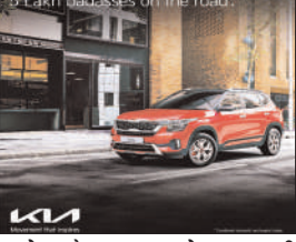
9.5 Lakh bad sales on the road.

रांची(प्रभात मंत्र संवाददाता): भारत की सबसे पसंदीदा एसयूवी और किआ इंडिया की पहली और सबसे ज्यादा बिकने वाली प्रीमियम एसयूवी, सेल्टोस ने अपने लॉन्च के सिर्फ 46 महीनों के भीतर ही 5 लाख के बिक्री आंकड़े को पार कर लिया है। आइकॉनिक ब्रांड और ऑरिजनल बैडआस के रूप में विख्यात सेल्टोस ने अगस्त 2019 में किआ के भारत में प्रवेश के साथ अपने सफर की शुरुआत की थी। इसके बाद से सेल्टोस ने एसयूवी सेगमेंट को नए सिरे से परिभाषित किया है और ग्राहकों को कई नए फीचर्स उपलब्ध कराए हैं। यह अपने डेरा सेगमेंट-फर्स्ट फीचर्स, दमदार परफॉर्मंस, क्लास-लीडिंग कनेक्टिविटी और फ्यूचरिस्टिक डिज़ाइन के साथ भारत के ऑटोमोटिव उद्योग का चमकता सितारा बन चुकी है। आज से चार साल पहले, सेल्टोस ने भव्य कार्यक्रम के साथ वैश्विक बाजार में प्रवेश किया था। इस एसयूवी को प्रीमियम ड्राइविंग अनुभव की तलाश कर रहे समझदार और आधुनिक सोच वाले ग्राहकों को ध्यान में रखकर डिज़ाइन किया गया था। मेक इन इंडिया, फॉरवर्ड वल्यू को दूरदर्शी सोच के साथ पेश की गई, सेल्टोस ने डिज़ाइन, परफॉर्मंस और टेक्नोलॉजी के अपने बेजोड़ संगम के साथ बाजार में क्रांति लाते हुए, एसयूवी सेगमेंट में खुद को एक गेम-चेंजर के रूप में स्थापित किया है। इसने ग्राहकों का दिल और धरोसा जीता है और इसी के साथ देश का सबसे लोकप्रिय और भरोसेमंद ऑटोमोटिव ब्रांड बन गया है। किआ इंडिया की शुद्ध बिक्री में 55% का योगदान देते हुए सेल्टोस ने कंपनी की सफलता में महत्वपूर्ण भूमिका निभाई है।