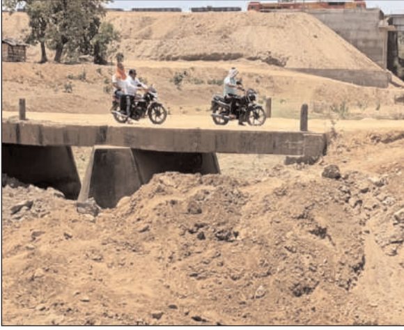
हालांकि घायलों को हल्की चोट लगी है। बता दें कि घटना स्थल से महज डेढ़ सौ मीटर की दूरी पर रेलवे पुल का निर्माण कार्य चल रहा है।

प्रभात मंत्र संवाददाता बरवाडीह : बरवाडीह प्रखंड अंतर्गत पंचायत मंगरा से अमडीह पथ पर धरधरी नदी पर मुख्यमंत्री ग्राम सेतु योजना मद से पुल निर्माण कार्य शुरू किया गया है। शुक्रवार को लगभग अपराह्न दो बजे उक्त पुल के फाउंडेशन खोदने में एक साथ 45 हॉल कर पत्थर विस्फोट करने वाले विस्फोटक सामग्री का स्तमाल कर विस्फोट कर दिया गया, विस्फोट इतना जबरदस्त था कि लगभग तीन सौ मीटर की दूरी तक जमीन थरा गया। उक्त विस्फोटक सामग्री जिलेटिन रॉड, डिटोनेटर भी हो सकता है। ठेकेदार द्वारा उक्त विस्फोटक सामग्री कहाँ से कैसे घटना स्थल पर लाया गया यह जांच का विषय है। वहाँ कई पर छतिप्रस्त होने के साथ ग्रामीण घायल हुए,