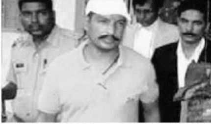
इसके बावजूद भी सुरक्षा व्यवस्था को लेकर कोई खास सुधार नहीं हो पाया।