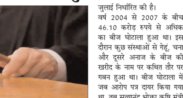
को डिस्ट्रिक्ट पिटीशन पर सुनवाई हुई। सत्यानंद भोक्ता की ओर से सहाय के रूप में आरटीआई से प्राप्त दस्तावेज को कोर्ट में प्रस्तुत किया गया। अदालत ने मामले में अगली सुनवाई की तिथि एक