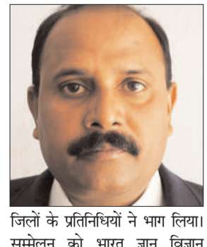
प्रभात मंत्र संवाददाता

साहेबगंज : झारखंड में पिछले करीब तीस वर्षों से जन विज्ञान आंदोलन से जुड़े एवं लोगों में वैज्ञानिक दृष्टिकोण के विकास एवं विस्तार के लिए प्रतिबद्ध संस्था साइंस फार सोसायटी, झारखंड का तीन दिवसीय सांगठनिक राज्य सम्मेलन संपन्न हो गया। 3 एवं 4 जून 2023 को डीएवी आलोक पब्लिक स्कूल, पुनदगा, रांची, झारखंड में आयोजित इस सम्मेलन में झारखंड के विभिन्न