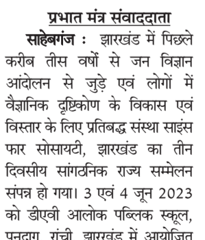
प्रभात मंत्र संवाददाता

साहेबगंज : झारखंड में पिछले करीब तीस वर्षों से जन विज्ञान आंदोलन से जुड़े एवं लोगों में वैज्ञानिक दृष्टिकोण के विकास एवं विस्तार के लिए प्रतिबद्ध संस्था साइंस फार सोसायटी, झारखंड का तीन दिवसीय सांगठनिक राज्य सम्मेलन संपन्न हो गया। 3 एवं 4 जून 2023 को डीएवी आलोक पब्लिक स्कूल, पुनदगा, रांची, झारखंड में आयोजित इस सम्मेलन में झारखंड के विभिन्न