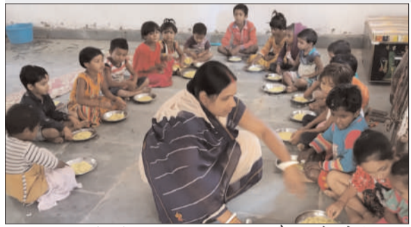
प्रभात मंत्र संवाददाता

सेविका ने कई बार विभाग को दी जानकारी, नहीं हुआ समाधान