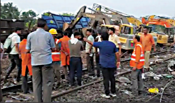
200 से अधिक शवों की नहीं हो सकी है पहचान : ओडिशा सरकार

ओडिशा में हुए दर्दनाक रेल हादसे में अभी तक 288 लोगों की मौत हो चुकी है. इस बीच ओडिशा सरकार ने कहा है कि 200 से अधिक शव ऐसे हैं जिनकी अभी तक पहचान नहीं हो सकी है. हादसे में मारे गए लोगों की तस्वीरें टैबल में रखी गई हैं और लोगों के परिवारों के जरिए अपने नुक़्तक परिजनों की पहचान कर रहे हैं. मारे गए बहुत सारे यात्री प्रवासी मजदूर थे इसलिए उनके परिवार धीरे-धीरे ओडिशा पहुंच रहे हैं.