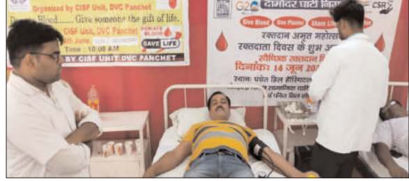
प्रभात मंत्र संवाददाता हजारीबाग : डेमोटॉड स्थित श्रीनिवास ब्लड सेंटर के द्वारा दिन बुधवार को विश्व रक्तदाता दिवस के अवसर पर विभिन्न जगहों पर रक्तदान शिविर लगाया गया। पहला रक्तदान शिविर हजारीबाग कॉलेज ऑफ डेंटल साइंस में लगाया गया। जहाँ कॉलेज में अध्ययनरत छात्र- छात्राएँ, डॉक्टर एवं कर्मियों ने रक्तदान कर मानवता का संदेश दिया। दुसरा रक्तदान शिविर पंचेत हिल अस्पताल एवं सीएसआर में लगाया गया। जहाँ पर कई लोगों ने