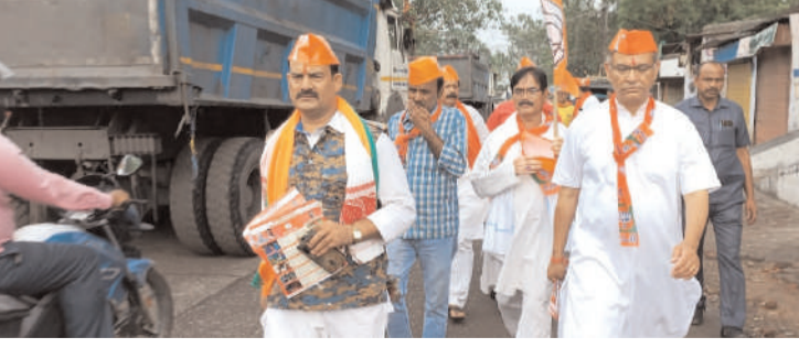
गया। विकास तीर्थ, सोशल मीडिया इम्प्लुएंसर्स की मदद, लाभार्थी सम्मेलन, वरिष्ठ कार्यकर्ताओं के साथ टिफिन पर भोजन व परिचर्चा, डोर टू डोर जनसम्पर्क, विशाल जनसभा, योग दिवस, संयुक्त मोर्चा सम्मेलन व व्यापारी सम्मेलन समेत

रामगढ़ : प्रधानमंत्री नरेंद्र मोदी की सरकार के ऐतिहासिक 9 वर्ष पूरे होने के उपलक्ष्य में भाजपा द्वारा देश भर में जून माह में महाजनसंपर्क अभियान चलाया गया। हजारीबाग लोकसभा में भी विराट स्तर पर महा जनसम्पर्क अभियान चलाया गया, जिसमें सांसद हजारीबाग सह अध्यक्ष वित्त सम्बन्धी संसदीय स्थायी समिति जयंत सिन्हा के नेतृत्व में हज़ारों कार्यकर्ताओं ने सहभागिता की। इस अभियान के तहत हजारीबाग संसदीय क्षेत्र के कोने-कोने में मोदी सरकार की जनकल्याणकारी योजनाओं का प्रचार-प्रसार किया गया। विकास तीर्थ, सोशल मीडिया इम्प्लुएंसर्स की मदद, लाभार्थी सम्मेलन, वरिष्ठ कार्यकर्ताओं के साथ टिफिन पर भोजन व परिचर्चा, डोर टू डोर जनसम्पर्क, विशाल जनसभा, योग दिवस, संयुक्त मोर्चा सम्मेलन व व्यापारी सम्मेलन समेत