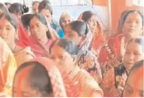
सुंदर फूलों की सजावट और आकर्षक विद्युत लाइटों से सजाया संवारा गया है। आगामी सोमवार को भव्य भंडारे के साथ वार्षिकोत्सव का समापन किया जाएगा। इधर हरे राम हरे कृष्ण, हर हर महादेव के नारों से पूरा गांव भक्तिमय बन उठ

सिरका : हेसला के ग्रामीण भक्तों के द्वारा रविवार को महेश्वर धाम शिव मंदिर के प्रांगण में दो दिवसीय वार्षिकोत्सव का शुभारंभ भक्ति भाव के साथ किया गया। अवसर पर महिला, पुरुष, बच्चे, युवा शिव भक्तों ने भगवान भोलेनाथ के 24 घंटों के अखंड हरी कीर्तन में शामिल होकर जयकारे लगाए। पहले दिन महादेव के शिवलिंग पर रुद्राभिषेक, विधिवत पूजन, आरती के बाद प्रसाद वितरण किया गया। वार्षिकोत्सव को लेकर गांव के सभी काफी उत्साहित और भक्ति में सरोवर देखे। बाबा के मंदिर को