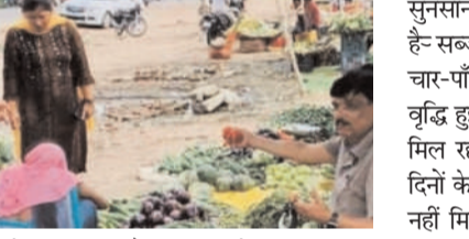
फिसालों ने कहा कि पैदावार कम होने से सब्जी के दाम बढ़ जाते हैं सब्जियों के दाम बढ़ने के साथ गरीब वर्ग की थाली से हरी सब्जियां गायब हो गयी हैं, सब्जियों के दाम बढ़ने व मंडी में कम मिलने के कारण यह परेशानी हो रही है सब्जी बेचने वालों की संख्या पहले की तुलना में काफी कम हो गयी है। इससे हर वक्त गुलजार रहने वाली सब्जी मंडी

गिद्धी : कोयलांचल में आसमान छूने लगे सब्जियों के दाम 100 रुपये प्रतिकिलो बिक रहा टमाटर बाजार में सब्जी बेचने वालों की संख्या पहले। की तुलना में काफी कम हो गयी है। मौसम आते ही सब्जी की कीमतों में उछल आ गयी है। हर सब्जी की कीमत बढ़ गयी है। बरिश के साथ महंगे बिक रहा है। टमाटर की कीमत 100 रुपये प्रतिकिलो है। 40 रुपये प्रतिकिलो बिकने वाला शिमला मिर्च 80 रुपये प्रतिकिलो बिक रहा है। बरसात में किसान धान की खेती में जुट जाते हैं, ऐसे में सब्जी की खेती कम होती है। बरसात में सब्जियां भी नष्ट होती हैं। इससे बरसात आते साग-सब्जी की कीमत बढ़ जाती है।