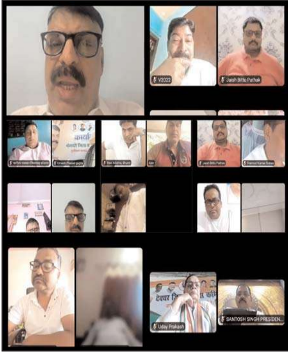
स्तर तक की गठित कमेटियों की समीक्षा की गई। बैठक को