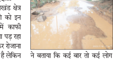
ने बताया कि कई बार तो कई लोग गिर भी चुके हैं, मगर भगवान का शुक्र है कि कोई दुर्घटना नहीं हुआ। मगर इसे अन्देखा करने से कभी भी कोई दुर्घटना हो सकती है।

प्रभात मंत्र संवाददाता तिरुलडीह : कुकुडु प्रखंड क्षेत्र के खुदीलौंग गांव के लोगों को इन दिनों गांव से निकलने में काफी कठिनाइयों का सामना करना पड़ रहा है। बता दें इसी रास्ते से होकर रोजाना ग्रामीणों को निकलना पड़ता है लेकिन गांव के मुख्य मार्ग में प्रवेश पथ पर गड्डा हो जाने से जल जमाव हो जाता है और लोगों को काफी कठिनाइयों का सामना करना पड़ता है। ग्रामीणों ने बताया कि कई बार तो कई लोग गिर भी चुके हैं, मगर भगवान का शुक्र है कि कोई दुर्घटना नहीं हुआ। मगर इसे अन्देखा करने से कभी भी कोई दुर्घटना हो सकती है।