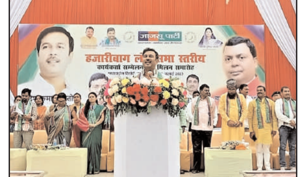
प्रमुख ने कहा कि जिन्होंने कभी पसीना नहीं बहाया वे सत्ता की

प्रभात मंत्र संवाददाता रांची। आजसू अध्यक्ष सुदेश कुमार महतो ने कहा कि हेमंत सरकार ने भ्रष्टाचार को शिष्टाचार बना दिया है। इसके कारण आम लोग लाचार हो गए हैं। उन्होंने कहा कि हेमंत सोरेन सरकार का काम और विकास के दावे सिर्फ सरकारी खर्चों में लटकने नजर आते हैं। इन सबके बीच सरकार कुछ ऐसा एजेंडा सेट करती है जिसमें जनता के बीच भ्रम, संशय और उलझन कायम रहे। झारखंड के मुद्दे, विचार, विषय और जनभावना से