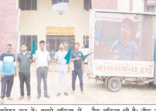
आवेदन कर दें। इससे प्रक्रिया में ज्यादा समय नहीं लगता है। अगर आपको बहुत जल्दी जन्म प्रमाण पत्र बनवाना है तो इसके लिए फास्ट ट्रैक प्रक्रिया भी है। ठीक उसी तरह 21 दिनों की निर्धारित अवधि के भीतर मृत्यु दर्ज करने में विफलता की स्थिति में, व्यक्ति को एक गैर-आपत्ति प्रमाण पत्र (एनओसी) प्राप्त करना होगा, जो तब जारी किया जाता है जब मृत्यु के एक वर्ष से अधिक समय तक मृत्यु प्रमाण पत्र प्राप्त नहीं किया गया हो। मृत्यु का तथ्य तय करने ताकि मृतक को सामाजिक, कानूनी और आधिकारिक बाध्याताओं से मुक्त किया जा सके। संपत्ति पर दावा करने के लिए इस प्रमाण पत्र की जरूरत होती है। पुत्र/तैनी संपत्ति का निबटारा और परिवार को मिलने वाले इश्योरेंस, पेंशन जैसे फायदों के लिए इस प्रमाणपत्र की आवश्यकता होती है।