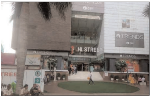
प्रभात मंत्र संवाददाता रांची। रविवार को अचानक न्यूक्लियस हाइट मॉल में संचालित

हड़कंप मच गया। मॉल के कई दुकानों की फूड सेफ्टी टीम ने छापेमारी कर खाद्य सामग्रियों की जांच की। वहीं कई दुकानों से खाद्य सामग्रियों का सैंपल लिया है। सेफ्टी ऑफिसर ने सैंपल लेकर जांच के लिए लैब भेज दिया है। सूचना है कि न्यूक्लियस हाइट मॉल में मिलावटी की शिकायत फूड सेफ्टी विभाग को मिली थी, जिसके बाद अधिकारियों की टीम ने छापे मारा। अधिकारियों का कहना है कि जांच में अगर मिलावट पाया गया तो उनपर कार्रवाई की जायेगी।