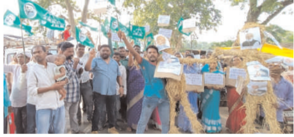
घटना को लेकर जितनी भी निंदा की जाए कम होगी। भाजपा शासित राज्य मणिपुर में आदिवासी महिलाओं के साथ कुकृत्य असहनीय है एवं झारखंड प्रदेश के भाजपा प्रदेश