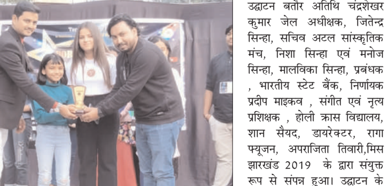
झारखंड, गायन प्रतियोगिता वाइस आफ झारखंड एवं सौंदर्य प्रतियोगिता मिस्टर एंड मिस

हजारीबाग : प्रतिभा तब तक कोई प्रतिभा नहीं है, जब तक कि इसका उपयोग अन्य लोगों के लाभ एवं अपने व्यक्तिगत विकास के लिए नहीं किया जाता है। हर व्यक्ति प्रतिभा के साथ जन्म लेता है इसी सोच के साथ नगरीय प्रतिभाओं के साथ साथ ग्रामीण प्रतिभाओं को एक बेहतर मंच प्रदान करने के उद्देश्य से तरंग रूप हजारीबाग द्वारा एवं लायंस क्लब ऑफ हजारीबाग राँची के सौजन्य एवं फहिमा एकाडमी, रिश्ता पोलिमेयर के संयुक्त तत्वावधान में राज्य स्तरीय नृत्य प्रतियोगिता डांसिंग स्टार ऑफ