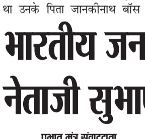
वकील थे उनकी माता का नाम प्रभावती था नेता जी भारत के स्वतंत्रता संग्राम के अग्रणी तथा सबसे बड़े नेता थे द्वितीय विश्व युद्ध के दौरान उन्होंने अंग्रेजों के खिलाफ लड़ने के लिए जापान के सहयोग से आजाद हिंद फौज का