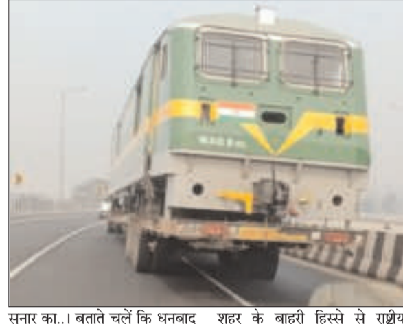
सुनार का... बताते चलें कि धनबाद शहर के बाहरी हिस्से से राष्ट्रीय

प्रभात मंत्र संवाददाता धनबाद : यूं तो रेलवे लाइन और रेलवे स्टेशन पर ट्रेनों पर सैकड़ों ट्रक को लाते-ले-जाते लोगों ने अक्सर देखा है। लेकिन कोलकाता-दिल्ली हाइवे पर राजगंज के समीप एक नजारा दिखा, जो लोगों को अर्चभित कर दिया। हाइवे पर एक ट्रक के टेलर पर ट्रेन इंजन कैबिनेट को लाद कर ले जाया जा रहा था। इस दौरान ट्रक जहां-जहां से गुजरी, लोक उत्सुकता वश इस नजारे को निहारने लगे। कुछ लोगों ने इसे देखकर यह कहावत भी कहा कि सौ चोट लुहार की... तो एक