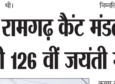
गठन किया था नेताजी सुभाष चंद्र बोस द्वारा दिया गया जय हिंद का नारा भारत का राष्ट्रीय नारा है नेताजी सुभाष चंद्र बोस के मन में देश प्रेम स्वाभिमान और साहस की भावना बचपन से हैं बड़ी प्रबल थी।