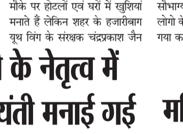
गठन किया था नेताजी सुभाष चंद्र बोस द्वारा दिया गया जय हिंद का नारा भारत का राष्ट्रीय नारा है नेताजी सुभाष चंद्र बोस के मन में देश प्रेम स्वाभिमान और साहस की भावना बचपन से हैं बड़ी प्रबल थी।