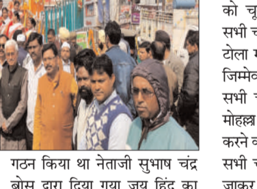
गठन किया था नेताजी सुभाष चंद्र बोस द्वारा दिया गया जय हिंद का नारा भारत का राष्ट्रीय नारा है नेताजी सुभाष चंद्र बोस के मन में देश प्रेम स्वाभिमान और साहस की भावना बचपन से हैं बड़ी प्रबल थी।