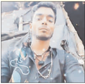
प्रभात मंत्र संवाददाता

अमड़ापाड़ा : थाना से महज सौ डेढ़ सौ गज की दूरी पर पीपीएल मोड़ स्थित एक टायर रिपेयरिंग की दुकान से एक साथ एक ही स्थान से दो बाइक की चोरी अपराधियों के बुलंद हौसले का परिचायक है। यही नहीं बाइक चुरा लेने के दुस्साहस के बाद पीड़ित को मोबाइल पर तबाह कर देने, गाली गलौज करने या जान मारने की धमकी देने का दोहरा अपराध करने