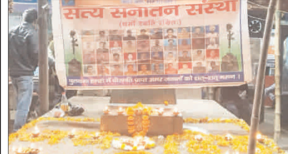
प्रभात मंत्र संवाददाता