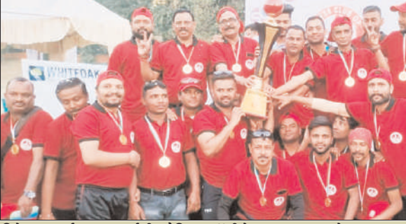
विजेता खरकई नाइटराइडर्स टीम चैम्पियन ट्रॉफी के साथ जश्न मनाते