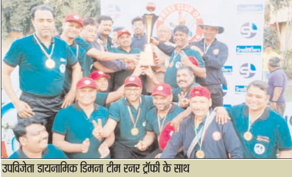
उपविजेता डायनामिक डिमना टीम खर ट्रॉफी के साथ

1 चौके और 1 छक्के लगाएं। सलामी बल्लेबाज नवीन ने 33 गेंदों पर 36 रन बनाए। लक्ष्य का पीछा करते हुए डायनामिक डिमना की टीम 15 ओवर में 4 विकेट पर 131 रन ही बना सकी। आशुतोष ने 44 गेंदों में 10 चौके की मदद से 61 रन बनाए। बुलंद ने 10 गेंदों पर दो चौके की मदद से 19 रन बनाए । लेकिन अपनी टीम को जीत दिलाने में असफल रहे। अभिजीत ने 10 और