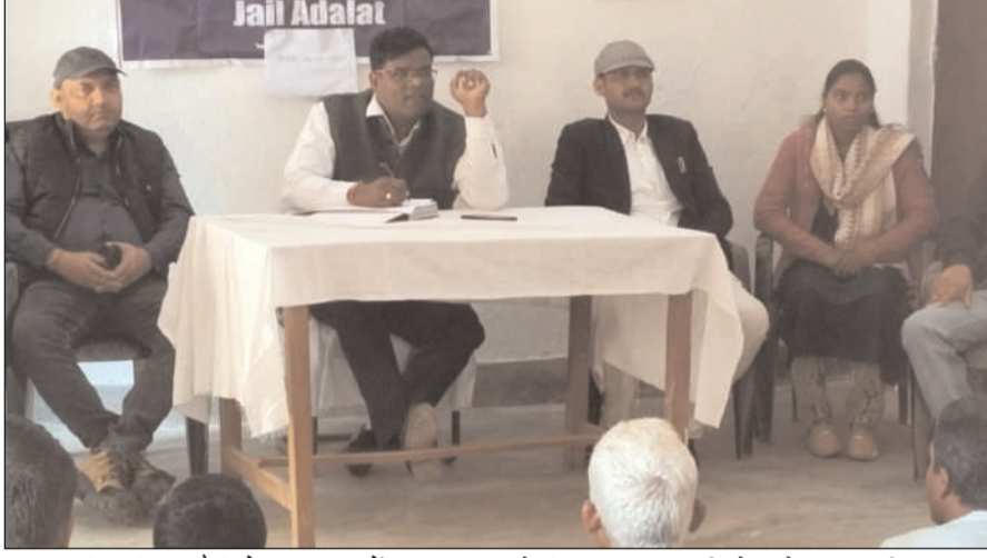
बताया कि जिन कैदियों का जमानत हो चुका है किंतु जमानत के कठिन शर्तों के कारण वह जमानत पर बाहर नहीं आ सका जैसे कैदियों को पहचान कर अतिरिक्त डालसा कार्यालय को सूचित करें। क्योंकि माननीय