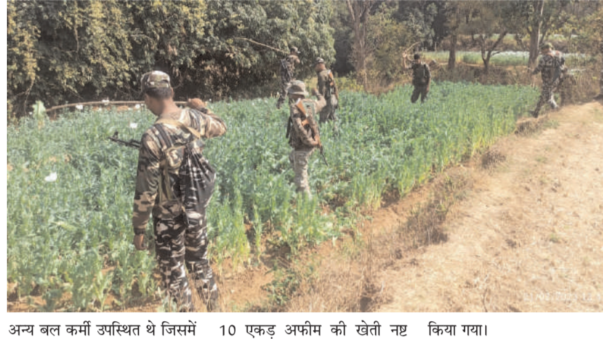
अन्य बल कर्मी उपस्थित थे जिसमें 10 एकड़ अफीम की खेती नष्ट किया गया।