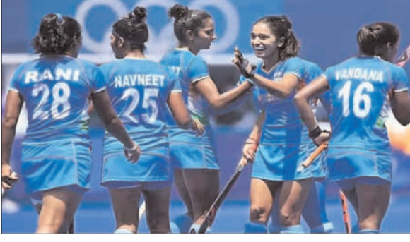
की गयी है। गौरतलब है कि रांची में होने वाली महिला हॉकी ओलंपिक क्वालिफाइंग प्रतियोगिता में 8 देशों की टीम एक-दूसरे के खिलाफ जोर आजमाइश करेंगी। जापान, जर्मनी, भारत, चेक रिपब्लिक, अमेरिका,

उसे भी पार्क प्राइम होटल में ही ठहराया जाना है। यूएसए की टीम भी इसी दिन रांची में होगी जिसे होटल रेडिसन ब्लू में ठहराया जायेगा। छह जनवरी को जर्मनी और क्रेच रिपब्लिक की टीमों रांची आएगी। यह दोनों टीम भी रेडिसन ब्लू में रहेगी। सात जनवरी को न्यूजीलैंड, चिली और जापान की टीमों रांची आएगी और स्टेशन रोड स्थित होटल चाणक्य बीएनआर में रहेगी। मैच ऑफिशियल 11 जनवरी को रांची आएगी, जिनके ठहरने की व्यवस्था होटल ली लेक सरोवर में