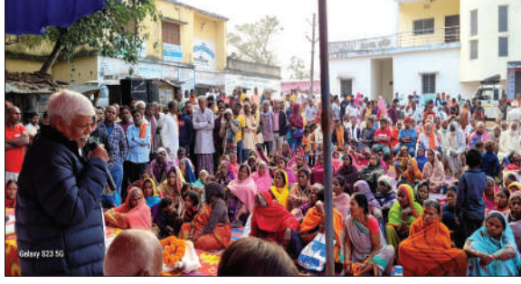
योजना, प्रधानमंत्री विश्वकर्मा योजना, किसान सम्मान निधि, जनधन योजना, सुरक्षा बीमा योजना, जनजीवन मिशन, पोषण अभियान सहित सैकड़ों योजनाएं चलाई जा रही हैं। जिसका लाभ देश के सभी गरीब महिला किसान युवाओं तक पहुंचने का लक्ष्य है। मोदी जी के नेतृत्व में

प्रभात मंत्र संवाददाता मैदिनीनगर : विकसित राष्ट्र बनाने के सपनों को साकार करने के उद्देश्य को लेकर केंद्र की मोदी सरकार के द्वारा प्रत्येक पंचायत में जन कल्याणकारी योजनाओं का लाभ सीधे लाभार्थियों तक पहुंचाने के उद्देश्य से भारत संकल्प यात्रा की जा रही है। इस क्रम में पाटन के कई गांव में कार्यक्रम का आयोजन किया गया। कार्यक्रम में मुख्य अतिथि के रूप में उपस्थित पलामू सांसद विष्णु दयाल राम ने कहा कि मोदी सरकार की जनकल्याणकारी योजनाएं गांव, गरीब, दलित, आदिवासी, महिला, किसान व युवाओं को प्राथमिकता में रखकर चलाई जा रही हैं। जिसका लाभ उन्हें मिल रहा है। परंतु बहुत लोग योजनाओं के लाभ से अभी तक वंचित हैं। उन गरीब लाभार्थियों तक योजनाओं का लाभ पहुंचाने के उद्देश्य से ही यह भारत संकल्प यात्रा चलाई जा रही है। ताकि समाज के अंतिम व्यक्ति अंत्योदय तक विकास पहुंच सके। श्री राम ने कहा कि सभी पंचायत तक मोदी सरकार की प्रमुख योजनाएं जैसे प्रधानमंत्री आवास, जनजीवन मिशन, पोषण अभियान