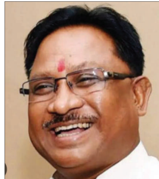
छत्तीसगढ़ की राजनीति के धुरंधर हैं विष्णुदेव साय

रायपुर : छत्तीसगढ़ के नए मुख्यमंत्री के चेहरे से पर्दा हट गया। विष्णुदेव साय प्रदेश के नए मुख्यमंत्री होंगे। इससे पहले रायपुर स्थित भाजपा के प्रदेश कार्यालय में विधायक दल की काफी लंबी बैठक चली। भाजपा के पर्यवेक्षक अर्जुन मुंडा, सर्बानंद सोनोवाल और दुष्यंत गौतम की रायपुर में नव निर्वाचित विधायकों के साथ बैठक की, जिसमें विष्णुदेव साय के नाम पर मुहर लगी। विधायक दल की बैठक के बाद फैसला हुआ कि सीएम पद की जिम्मेदारी विष्णुदेव साय संभालेंगे। जबकि डिप्टी सीएम पद की कमान अरुण साव और विजय शर्मा को मिली। पूर्व सीएम रमन सिंह स्पीकर होंगे। विष्णुदेव साय कुनकुरी विधानसभा क्षेत्र से विधायक हैं। सीएम के नाम का ऐलान होने के