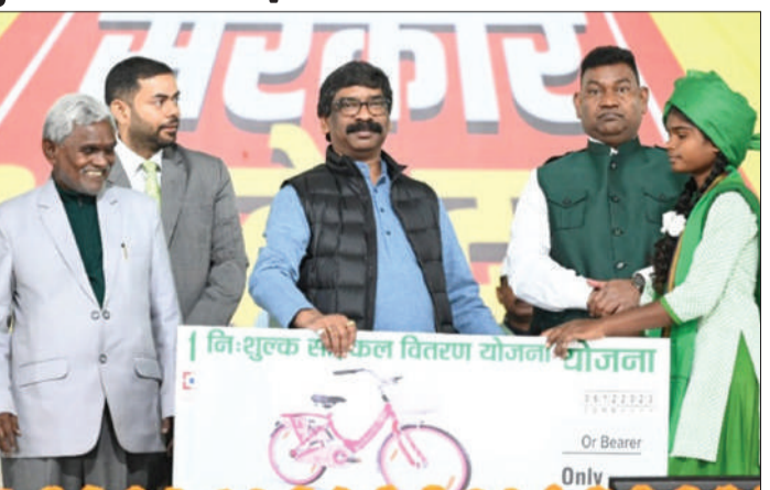
जिलों को मिलाकर कल्याण विभाग को सूची मिली थी। एसटी, एससी, बीसी एवं अन्य वर्ग के वैसे पात्र बच्चे जो वर्ष

2023 तक साइकिल खरीदने के लिए उनके बैंक खातों में राशि जमा की जा रही है। आपकी योजना-आपकी सरकार-आपके द्वार के शिविरों में मिल रहा है साइकिल वितरण योजना का लाभ आपकी योजना-आपकी सरकार-आपके द्वार के प्रत्येक शिविर एवं विशेष कैम्प के दौरान छात्र-छात्राओं के बीच साइकिल क्रय हेतु राशि का वितरण किया जा रहा है। सरकारी स्कूलों में अध्ययनरत छात्र-छात्राओं के बीच साइकिल वितरण हेतु सभी जिलों के उपायुक्तों द्वारा सूची भेजी गई है। सभी