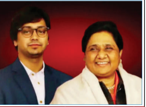
आकाश की लॉन्चिंग के बाद बसपा हुई कमजोर

बता दें कि यूपी में आकाश की लॉन्चिंग के बाद बसपा लगातार कमजोर ही हुई है। 2017, 2019 में पार्टी को बड़ी हार मिली तो वहीं 2022 के यूपी चुनाव में तो