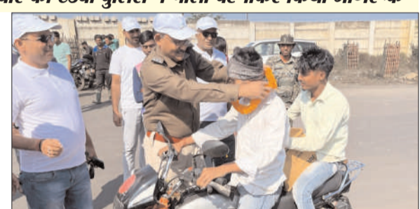
फूल देकर स्वागत किया गया एवं बिना हेलमेट वाले व बिना सीटबेल्ट वाले को टंडवा पुलिस द्वारा माला पहनाकर प्रेरित किया गया साथ ही सड़क सुरक्षा नियमों को बताया गया। सड़क सुरक्षा जागरूकता अभियान को बढ़वा देने के लिए क्रिकेट टूर्नामेंट का भी शुभारंभ किया गया। सड़क सुरक्षा के सभी नियमों का पालन करने को लेकर

बिना हेलमेट के बाइक सवार को टंडवा पुलिस ने माला पहनाकर किया जागरूक रहुल कुमार सिंह/प्रभात मंत्र टंडवा : प्रखंड के राहम सेवा फाउंडेशन के तत्वाधान में सड़क सुरक्षा जागरूकता अभियान को बढ़वा देने के लिए सड़क में चलने वाले राहगीरों को जागरूक किया गया। जिसमें सड़क सुरक्षा मानकों के तहत चार पहिया वाहन को सीट बेल्ट लगाकर चलने, शराब पीकर वाहन ना चलाने, अधिक जन संख्या वाले थेरो में धीमी गति से वाहन चलाने, हेलमेट पहनकर एवं धीमी गति से बाइक चलाने, सड़क की बाई तरफ चलने तथा ओवरलोड लेकर न चलने की अपील की गई। सड़क पर हेलमेट पहने चालक एवं चारपहिया वाहनो में सीट बेल्ट लगाए चालकों को फाउंडेशन के सदस्यों के द्वारा गुलाब