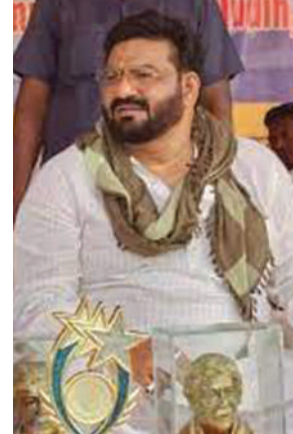
पिकनिक स्पॉट पर है विशेष व्यवस्था : पर्यटन मंत्री