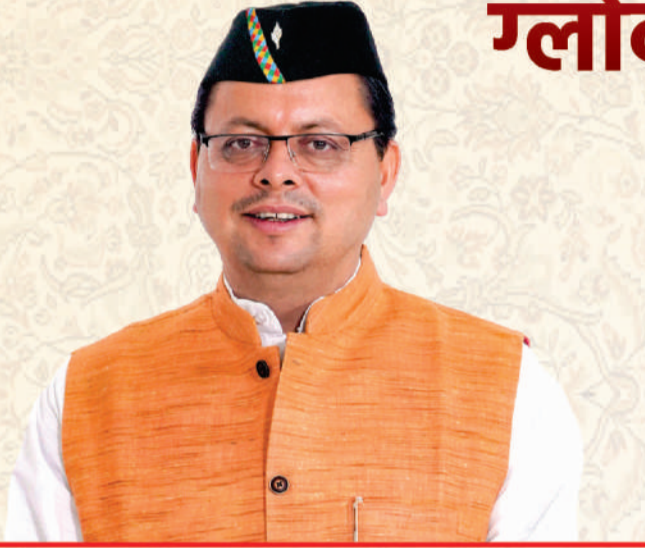
पुष्कर सिंह धामी मुख्यमंत्री, उत्तराखण्ड