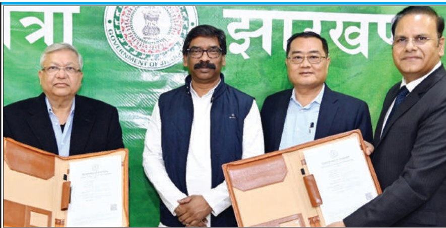
वरुण बेवरेजेस लिमिटेड रामगढ़ जिला के पतरातू में 456 करोड़ रुपए निवेश करेगी

प्रभात मंत्र संवाददाता रांची : मुख्यमंत्री हेमंत सोरेन की गरिमामयी उपस्थिति में कांके रोड रांची स्थित मुख्यमंत्री आवासीय कार्यालय में उद्योग विभाग, झारखंड सरकार एवं पेप्सिको की बाटलिंग कंपनी वरुण बेवरेजेस लिमिटेड के बीच मेमोरेंडम ऑफ अंडरस्टैंडिंग हस्ताक्षर सम्पन्न हुआ। इस अवसर पर मुख्यमंत्री हेमंत सोरेन ने कहा कि हमारी सरकार ने राज्य में एक बेहतर उद्योग पॉलिसी बनाई है। राज्य सरकार का प्रयास है कि राज्य के विभिन्न क्षेत्रों में अधिक से अधिक उद्योग स्थापित हों। मुख्यमंत्री ने कहा कि नई उद्योग नीति के तहत लगातार कई अच्छे और विश्वसनीय उद्योग संस्थानों द्वारा झारखंड में निवेश करने की इच्छा जाहिर की है। नई उद्योग नीति के तहत निवेशक अब राज्य में उद्योग स्थापित करने के लिए प्रेरित हो रहे हैं। पिछले कुछ महीनों में कई जाने-माने उद्योग संस्थाओं द्वारा जमशेदपुर सहित अन्य जगहों पर अपने-अपने-अपने का निवेश किया है। मुख्यमंत्री ने कहा