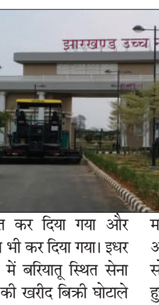
झारखण्ड उच्च न्यायालय