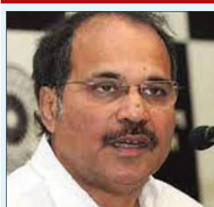
बहाल किया जाए और गृह मंत्री आरंभ सदन में जाकर बयान दें। अधीर ने कहा कि गृह मंत्री रोज टीवी पर बयान देते हैं। संसद की सुरक्षा के लिए

लोकसभा से अपने निलंबन पर लोकसभा में कांग्रेस के नेता अधीर रंजन चौधरी ने कहा कि मेरे समेत सभी नेताओं को निलंबित कर दिया गया है। हम कई दिनों से मांग कर रहे हैं कि हमारे जिन सांसदों को पहले निलंबित किया गया था उन्हें बहाल किया जाए और गृह मंत्री आरंभ सदन में जाकर बयान दें। अधीर ने कहा कि गृह मंत्री रोज टीवी पर बयान देते हैं। संसद की सुरक्षा के लिए