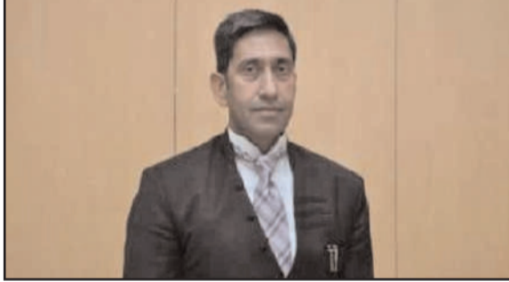
नोटिफिकेशन में कहा गया है कि हाई कोर्ट के चीफ जस्टिस कार्यालय की ड्यूटी के निर्वहन के लिए नियुक्त किया गया है, जो 29