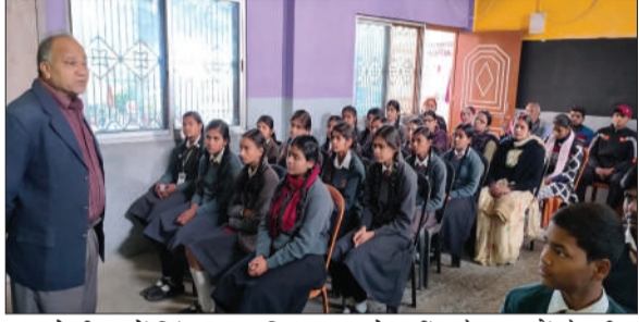
जीएन कान्वेंट स्कूल में वीर बाल दिवस के कार्यक्रम में सीनियर वर्ग के छात्र-छात्राओं ने हिस्सा लिया।