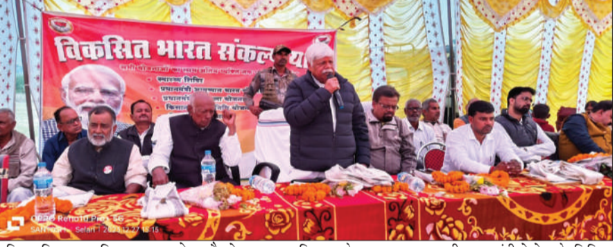
विकसित भारत संकल्प यात्रा पाटन प्रखंड के ग्राम पंचायत सुम एवं लोड़गा पहुंची।

प्रभात मंत्र संवाददाता मेदिनीनगर : विकसित भारत संकल्प यात्रा पाटन प्रखंड के ग्राम पंचायत सुम एवं लोड़गा पहुंची। वतौर मुख्य अतिथि पलामू सांसद विष्णु दयाल राम ने आमजनो को संबोधित करते हुए कहा कि मोदी जी की गारंटी वाली गाड़ी आप सभी के पंचायतो में पहुंची है। केंद्र कि मोदी सरकार द्वारा गरीबों महिलाओं युवाओं किसानों के लिए चलाए जा रहे जन कल्याणकारी योजनाओं की जानकारी दे रहा है। जो भी लाभुक योजनाओं से वंचित रह गए हैं वे सभी समयबद्ध इसका लाभ ले सकें। देश में अमृत काल चल रहा है। प्रधानमंत्री नरेंद्र मोदी का सपना है कि भारत को 2047 तक आत्मनिर्भर विकसित राष्ट्र बनाना। देश को समृद्ध बनाने में गांव गरीब