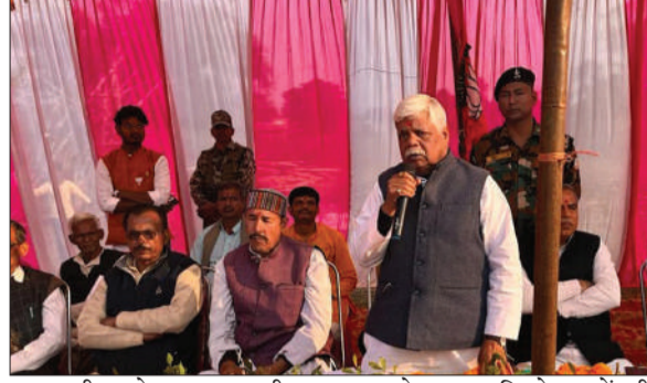
सुरक्षा बीमा योजना, जल जीवन मिशन, प्रधानमंत्री गरीब कल्याण अन्न योजना इत्यादि योजनाओं की समुचित जानकारी जनता को दी जा रही है। इसका मुख्य उद्देश्य समाज के आखिरी व्यक्ति तक योजनाओं की जानकारी को पहुंचाना और उनके बीच केन्द्र सरकार की योजनाओं को लेकर प्रचार-प्रसार के माध्यम से जागरूकता पैदा करना तथा उन्हें उपरोक्त सभी योजनाओं का लाभ दिलाना है।

प्रभात मंत्र संवाददाता गढ़वा : सांसद पलामू विष्णु दयाल राम ने गढ़वा जिला के मेराल प्रखंड अंतर्गत ग्राम पंचायत चामा में विकसित भारत संकल्प यात्रा के आयोजित कार्यक्रम में मुख्य अतिथि के रूप में शामिल हुए। उक्त कार्यक्रम में जेएसएलपीएस के माध्यम से स्वयं सहायता समूह की महिलाओं के बीच में 50 लाख 25 हजार रुपए की चेक प्रदान एवं स्वास्थ्य शिविर का भी उद्घाटन किए। उक्त कार्यक्रम में जरूरतमंदों के बीच कंबल का वितरण भी किया गया। इसके साथ ही साथ मेराल प्रखंड में प्रधानमंत्री ग्राम सड़क योजना के तहत स्वीकृत 5 सड़कों कुल 36.5 किलोमीटर, लागत (33 करोड़ 28 लाख रुपए) के निर्माण कार्य का शिलान्यास किया। उक्त सड़क निम्नलिखित है- (1) मेराल से करकोमा पीपरा डेलिया होते हुए हासनदाग तक 6.25 किलोमीटर। (2) लखेया मोड़ से हासनदाग कजराठ होते हुए डंडई