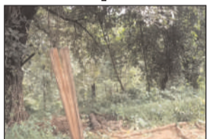
बढ़निया, होरिलौंग, हुंटर, सिंघौरवा और पुटवागढ़ वन क्षेत्र के घने जंगलों को प्रतिदिन सैकड़ों छोटे बड़े पेड़ों की अवैध कटाई कर उखाड़ा जा रहा है जिसपर वन अधिकारी अनदेखी करते ऑफिस में बैठकर तमाशा देख रहे हैं या वन क्षेत्र में चहलकदमी करने वाले वनकर्मियों की मिलीभगत का नतीजा है ऐसा प्रतीत होता है। बता दें कि कुछ महीने पहले से ही पेड़ों की कटाई के साथ विशालकाय पेड़ों को काटकर जंगल में ही चिरान कर उसे बेखोफ होकर तस्करी किया जा रहा है। सुर्जो से मिली जानकारी अनुसार सीज किए गए खसुआ के बोटा का चिरान किया गया है, जिसका खुलासा जल्द होने वाला है। वहीं इस संबंध में वन कर्मियों से संपर्क करने की कोशिश की गई पर उनके मोबाइल बंद बता रहे हैं।