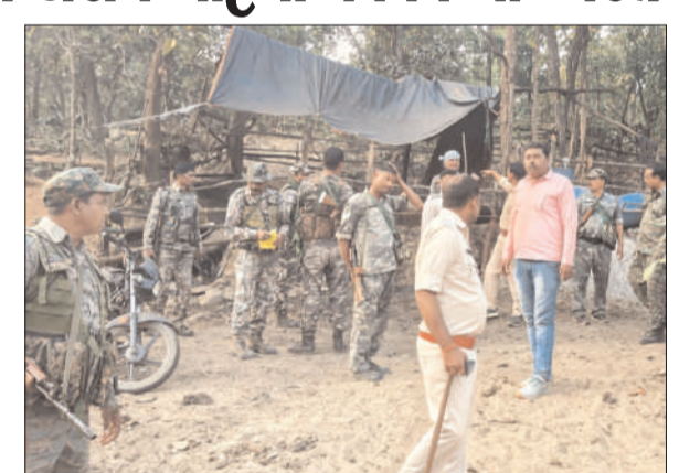
रूप से युक्त स्थल पर छापेमारी चला नेतृत्व गावां थाना प्रभारी सत्री कर अवैध शराब भट्टियों को ध्वस्त करके हुए जावा महुआ और शराब को नष्ट कर दिया गया। टीम का समेत कई कर्मी शामिल थे।

प्रभात मंत्र संवाददाता गावां : थाना क्षेत्र के गाडीसॉख, ककडियार, झरझारा व राजोखार में संचालित अवैध शराब भट्टियों को गावां पुलिस और वन विभाग की टीम ने छापेमारी अभियान चला कर चार भट्टियों को ध्वस्त कर दिया। साथ ही पंद्रह से बीस किंटल जावा महुआ और तीन से चार गेलन शराब को नष्ट कर दिया गया। मिली जानकारी के अनुसार गावां पुलिस को गुप्त सूचना मिली थी कि थाना क्षेत्र के सुदूरवर्ती जंगलों में अवैध रूप से भट्टी लगा कर जहरीली शराब का चुराई किया जा रहा है। सूचना के बाद गावां पुलिस की टीम और वन विभाग की टीम ने संयुक्त