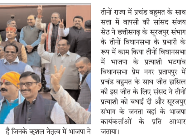
हैं जिनके कुशल नेतृत्व में भाजपा ने