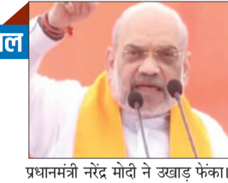
प्रधानमंत्री नरेंद्र मोदी ने उखाड़ फेंका।

लोकसभा में जम्मू कश्मीर पर कांग्रेस समेत विपक्षी दलों के हमलों का जवाब देते हुए अमित शाह ने कहा था कि कश्मीर में 45 हजार लोगों की मौत का जिम्मेदार अनुच्छेद 370 था, जिसे