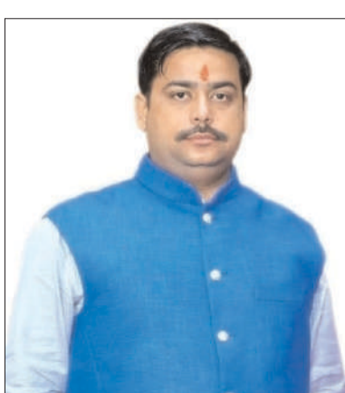
कांग्रेस द्वारा जम्मू-कश्मीर में धारा 370 लगाने