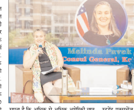
सपना है कि अधिक से अधिक अमेरिकी छात्र भारत आएँ और वे भारत की विविधता, ऊर्जा यहां के लोगों के टैलेंट को करीब से जानें।