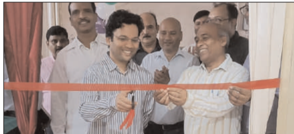
साफ सफाई पर विशेष ध्यान देने का निर्देश दिया। उन्होंने चिकित्सकों को समय पर अस्पताल में उपस्थित होने तथा टीम भावना के साथ कार्य करते हुए बेहतर सेवाएं जनता को उपलब्ध कराने का निर्देश दिया। सदर अस्पताल में अल्ट्रा साउंड सेंटर का उपायुक्त हिमांशु मोहन ने फीता काटकर शुभारंभ

प्रभात मंत्र संवाददाता लातेहार : उपायुक्त हिमांशु मोहन के द्वारा आज सदर अस्पताल का औचक निरीक्षण किया गया। इस दौरान उपायुक्त द्वारा आईसीयू, ओपीडी, एस्पानसीयू, प्रसव वार्ड, एमटीसी, डायलिसिस, जीव केंद्र, जिरियाट्रिक वार्ड, दवा स्टॉक के साथ विभिन्न वार्डों का निरीक्षण कर आवश्यक दिशा निर्देश दिया गया। इस दौरान उपायुक्त ने अस्पताल में भर्ती मरीजों को उपलब्ध कराया जा रही स्वास्थ्य सुविधाओं का जायजा लिया। निरीक्षण के क्रम में उपायुक्त ने सिविल सर्जन को स्पष्ट निर्देश दिया कि स्वास्थ्य सुविधा में किसी प्रकार की लापरवाही नहीं हो। उपायुक्त ने सदर अस्पताल में