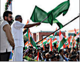
जगदीप धनखड़ ने कहा, हर घर तिरंगा जन जन का अभिमान है। पीएम ने जब बीते वर्ष इस अभियान का आह्वान किया तो बच्चों से लेकर बुजुर्गों तक यह अभियान पहुंचा। हर भारतीय को इस पर गर्व हुआ। केंद्रीय मंत्री अर्जुन राम मेघवाल ने इस दौरान कहा, प्रत्येक नागरिक को 15 अगस्त और 26 जनवरी को अपने घरों में तिरंगा प्रदर्शित करना चाहिए। यह नागरिकों का कर्तव्य है।

देश भर में निकाली गई तिरंगा रैली एजेंसी नई दिल्ली : आजादी का अमृत महोत्सव कार्यक्रम के अंतर्गत आज देशभर में तिरंगा रैली निकाली जा रही है। इसी सिलसिले में दिल्ली में आज तिरंगा बाइक रैली निकाली गई। इस मौके पर केंद्रीय मंत्री जी. किशन रेड्डी भी शामिल हुए। केंद्रीय मंत्री ने बाइक रैली शुरू होने से पहले कहा, आने वाले 15 अगस्त को देश के हर नागरिक को अपने घर पर तिरंगा फहराना चाहिए। यह आजादी का अमृत महोत्सव कार्यक्रम का समापन है और ऐसे मौके पर हर किसी को इसका हिस्सा बनना चाहिए। बाइक रैली की शुरुआत उपराष्ट्रपति ने तिरंगा दिखाकर की। इस दौरान उपराष्ट्रपति