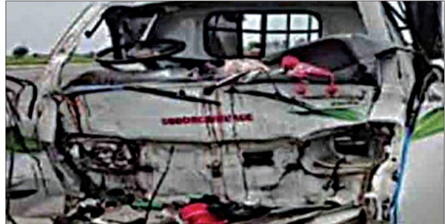
कि मालवाहक टेम्पो के परखच्चे उड़ गए और इसमें सवार 10 लोगों ने मौके पर ही दम तोड़ दिया। घटना की जानकारी मिलते ही कई एम्बुलेंस मौके पर पहुंचीं और घायलों को समीप के अस्पताल में ले जाया गया। पुलिस ने शवों को कब्जे में लेकर पोस्टमार्टम करवाया।

अहमदाबाद : अहमदाबाद के बावला-बगोदरा हाइवे पर भीषण सड़क हादसे में 10 लोगों की मौत हो गई। मृतकों में 5 महिलाएं, 3 बालक और 2 पुरुष हैं। दुर्घटना में 10 अन्य लोग घायल हो गए। मालवाहक टेम्पो में सवार लोग चोटिला में माता चामुण्डा का दर्शन कर लौट रहे थे। घटना की जानकारी मिलते ही एम्बुलेंस, पुलिस और स्थानीय प्रशासन मौके पर पहुंच गई। अहमदाबाद से करीब 50 किलोमीटर की दूरी पर बावला-बगोदरा में सड़क किनारे खड़े ट्रक से पीछे आ रहे मालवाहक टेम्पो ने जोरदार टक्कर मार दी। कपडबंज और बालासिनोर के 17 लोग मालवाहक टेम्पो में सवार होकर सुरेन्द्रनगर के चोटिला स्थित चामुण्डा माता के दर्शन के लिए गए थे। यहां दर्शन के बाद सभी लौट रहे थे। इसी दौरान बावला-बगोदरा के बीच मीठपुर पाटिया के पास सड़क किनारे पंचर ट्रक खड़ा था। इसी बीच पीछे से आ रहा मालवाहक टेम्पो सड़क किनारे खड़े ट्रक से टकरा गया। टक्कर इतनी जोरदार थी